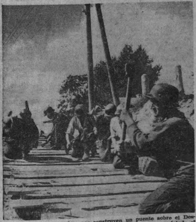
Tropas de Ingenieros alemanas construyen un puente sobre el Dniéper, en su marcha hacia el este de Kiev, donde se ha completado el cerco de cuatro ejércitos rojos