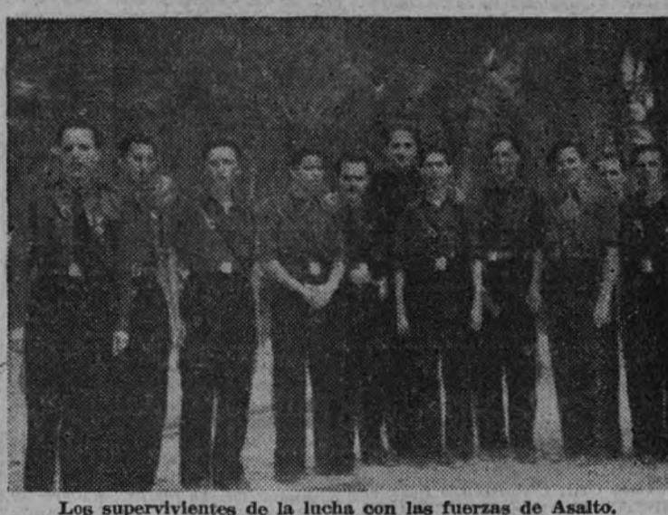
Los supervivientes de la lucha con las fuerzas de Asalto.