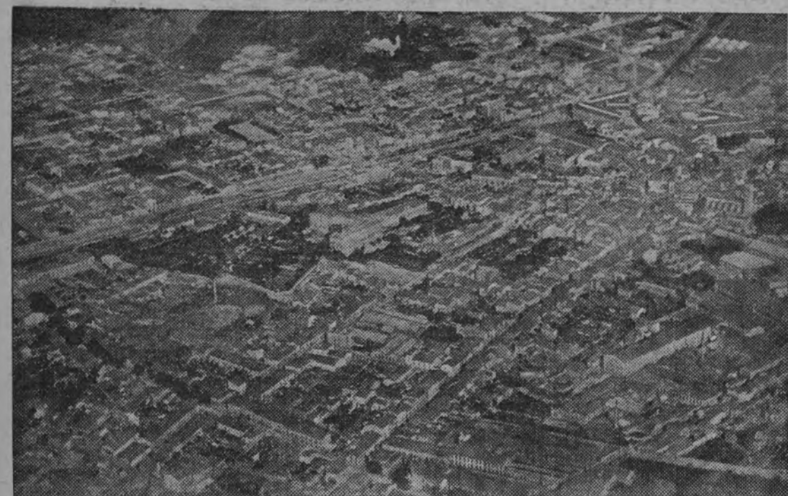
La ciudad de Tarrasa

Los 4.000 metros cúbicos que se precisan serán captados en las proximidades de Olesa de Montserrat