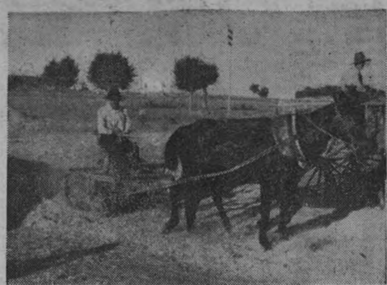
La trilla en la era.