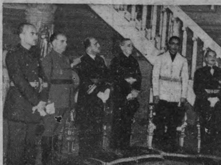
Los ministros de Asuntos Exteriores, Ejército, Marina, Hacienda, Agricultura y Obras Públicas durante el solemne teaturno celebrado en San Francisco el Grande con motivo de la Fiesta del Caudillo.

Hubo una misa, a la que asistieron las autoridades, jerarquías y