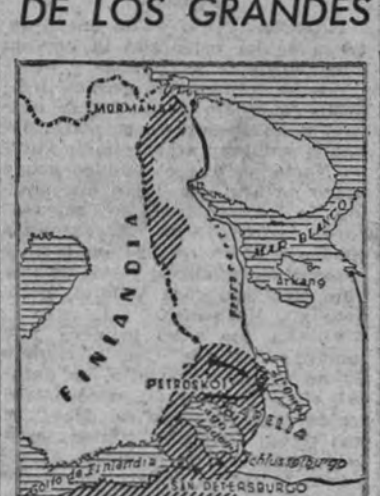
ES POSIBLE QUE SE ORDENE EL ATAQUE A SAN PETERSBURGO ANTES DE LOS GRANDES FRIOS

HELSINKI 1.—Petroskoi, la capital de la Carelia soviética, ha sido ocupada a primeras horas de la mañana por las tropas finlandesas que atacaban en diferentes direcciones.