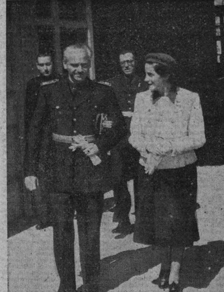
El ministro Presidente de la Junta Política y de Asuntos Exteriores, camarada Serrano Suñer, con la delegada nacional de la Sección Femenina del Partido, camarada Pilar Primo de Rivera, al salir de la recepción celebrada en el Palacio Nacional.

VICHY 1.—Según hace saber la Prensa parisina, actualmente se encuentran en circulación en Francia tres millones de tarjetas de abastecimiento falsas. Los modelos actualmente en servicio son muy fáciles de reproducir, y muchos impresores clandestinos fabrican imitaciones perfectas. Para terminar con este tráfico el Gobierno ha decidido cambiar los modelos de tarjetas, que en adelante serán hechas con un papel especial y adornadas de dibujos anillados que los falsificadores no podrán reproducir fácilmente. En virtud de las nuevas disposiciones los culpables podrán ser condenados a trabajos forzados y hasta a muerte, si el caso es particularmente grave. (Efe.)