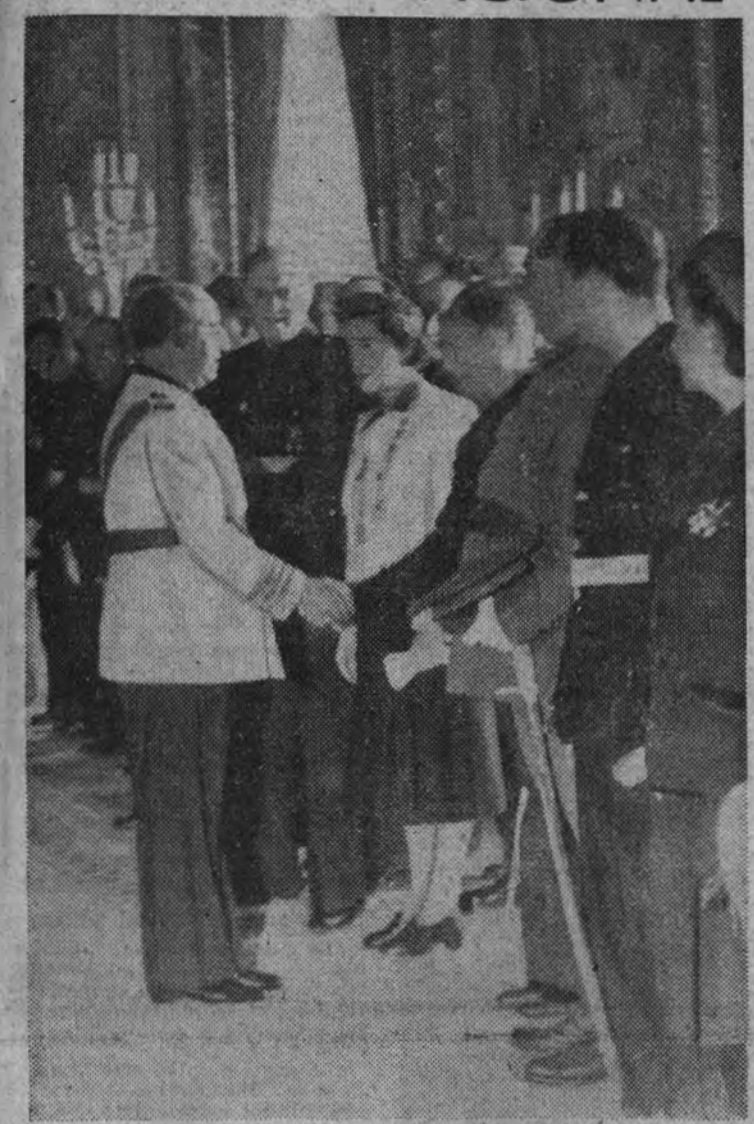
El Caudillo recibe el saludo de las personalidades que asistieron a la recepción celebrada en el Palacio Nacional.

"Gracias a Franco y al heroísmo de los españoles, el oeste de Europa se salvó de la bolchevización"