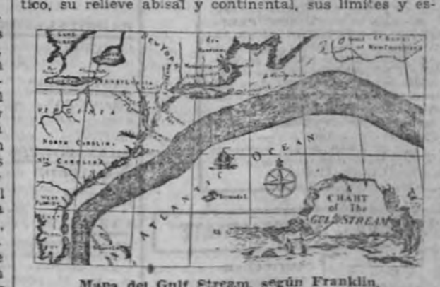
Mapa del Gulf Stream, según Franklin.

Le Danois expone la teoría de Wegener, que este desarrolló en su "Génesis de los Continentes". Para Wegener (y citamos nuestra "Teoría de la Atlántida"), "los continentes que hoy están separados por el globo formarían en el período carbonífero superior una única masa, pretijados unos contra otros, en muchos casos sin líneas de sutura, como lo están los miembros del feto en el claustro materno. Según su teoría de las traslaciones continentales, el mundo fué como desmenuzándose en varios sentidos, con una marcada tendencia de migración de porciones continentales hacia el Oeste y de una aproximación al Ecuador o "huida del Polo". "Groenlandia—resumo Le Danois—una el Labrador