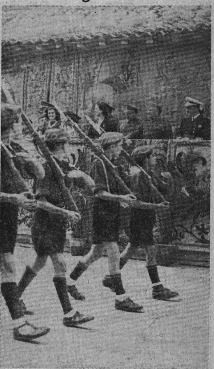
Con motivo de la fiesta onomástica del Caudillo se celebraron ayer en El Pardo diversos actos. Ante el Jefe Nacional, sus familiares, ministros y altas jerarquías desfilaron las flechas del Frente de Juventudes de la Falange.