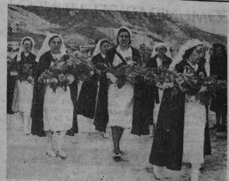
Las enfermeras de Sanidad Militar dirigiéndose a las tumbas de los mártires para depositar flores