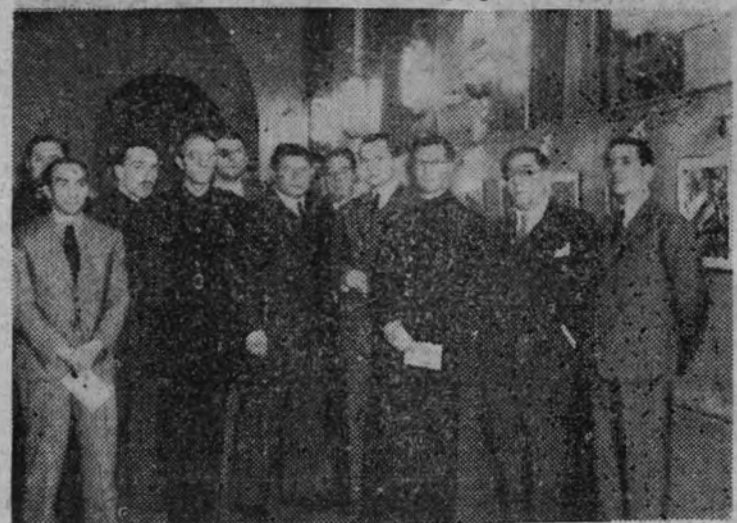
Personalidades españolas y alemanas que asistieron al acto inaugural

Concurrieron el delegado provincial Sin- dical y otras jerarquías y personalidades