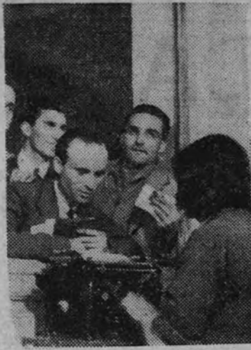
Un momento de la inscripción en las oficinas sindicales.

Los obreros esperan ante las oficinas de inscripción.