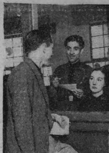
Un productor al hacer su inscripción.

(Entradas—si es que quedan—en los logares de costumbre.)