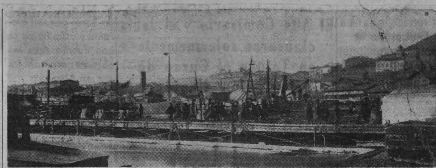
Los muelles de Vladivostok, una de las difíciles puertas con que sueña el comunismo.

El funeral que se celebre hoy, día 11 del actual, a las once de la mañana, en la iglesia parroquial de San José, se aplicará por el eterno descanso de su alma. Varios señores prelados han concedido indulgencias en la forma acostumbrada.