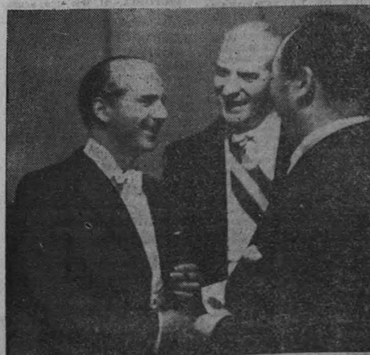
En el acto celebrado en el teatro Español, en las Fiestas de la Hispanidad, el ministro de Asuntos Exteriores, camarada Serrano Suñer, saluda a los miembros del Cuerpo diplomático.

El Caudillo ha dicho a las Falanges Femeninas: "Es necesario levantar a España, y vosotras vais a ser las adelantadas de la paz." Español: Ayúdanos a levantar España comprando el "Sello de José Antonio"