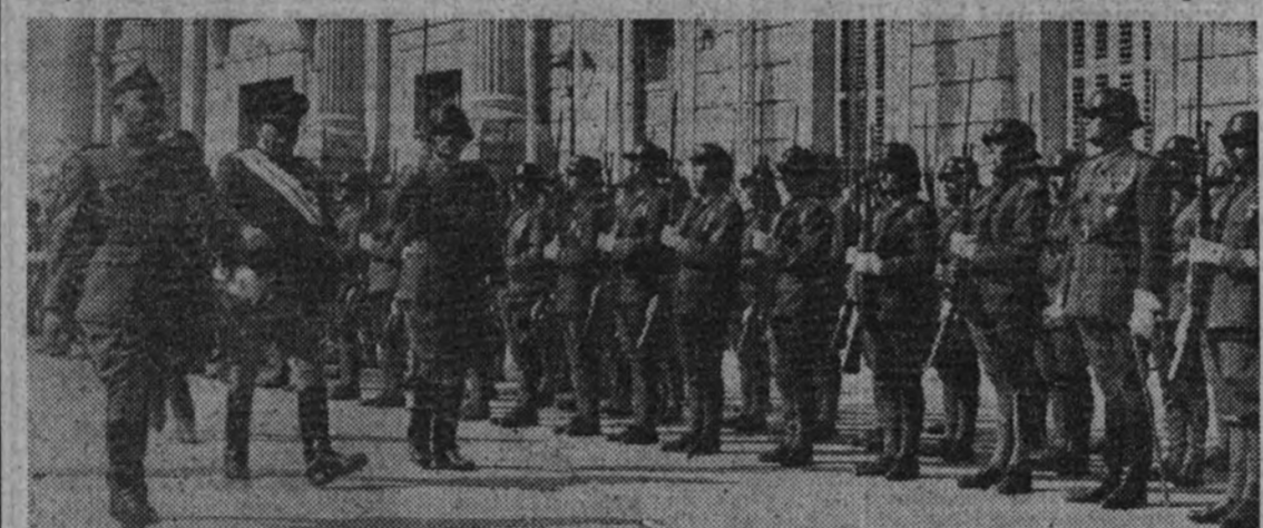
Su Excelencia el Caudillo revista a las fuerzas que le rindieron honores a su llegada al Consejo de la Hispanidad.

Más tanto para el ataque como para la defensa, renunciemos desde ahora a las innobles y desacreditadas argucias de ese mundo con fusos que se define con la palabra