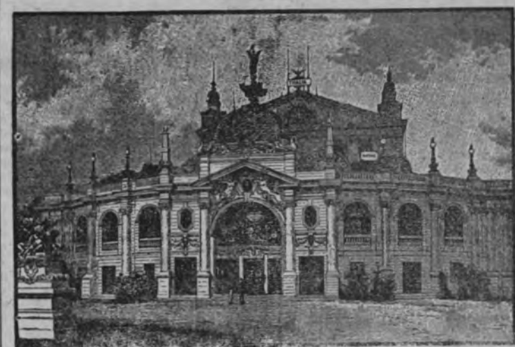
El teatro internacional del Prater (Exposición del Baile, en Viena, en 1892).