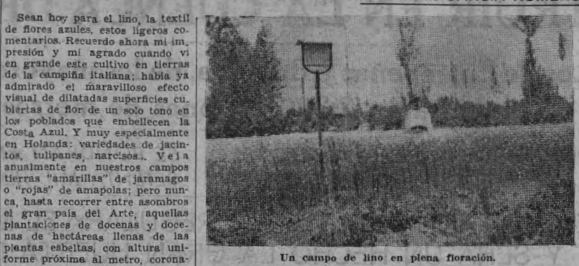
Un campo de lino en plena floración.

aplicaciones numerosas de sus fibras y, en franco camino de conseguirlo—la superficie, de unas 900 hectáreas escasas en 1931, se ha acercado a las 4.000 en 1940—surge otra orientación de esta planta, ya seguida con preferencia en muchos países: su cultivo no como fibra, sino para lo que hasta aquí veníamos considerando secundario: la obtención de semilla. Porque esta semilla, la linaza, contiene—algunas en proporciones crecidas: del 25 al 35 por 100—aceite llamado de linaza, aceite secante, tan preciso en las industrias de pintura, barnices, linóleo, hules, etc., etc.; por lo que la industria de este aceite podría dar trabajo a muchas fábricas de extracción de aceites de semillas exóticas, hoy en paro forzoso; porque subproducto de esta industria son esas tortas de linaza de tanto valor como pienso concentrado del ganado... La linaza, semilla, tiene múltiples usos, su contar la medicina casera: jesas, cataplasmas "quemantes" que todos sufrimos cuando niños!