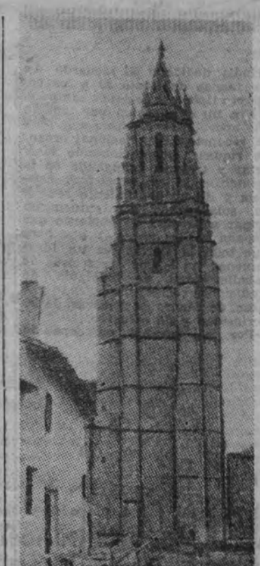
Esleita torre de la Colegiata de Ampudia, en la Tierra de Campos