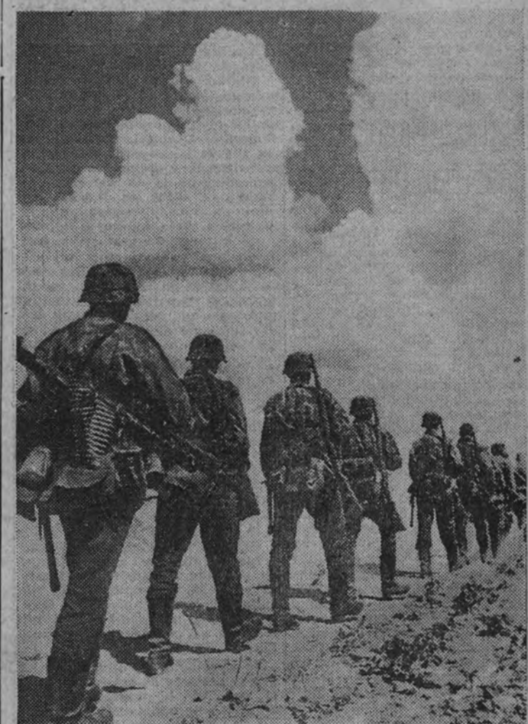
Soldados de la Infantería alemana avanzando por tierras de Rusia.