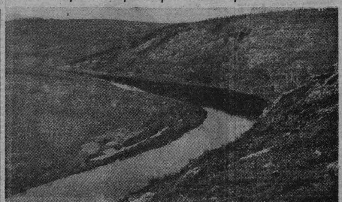
El río Duero en su curso alto, antes de pasar por Soria, poco después del lugar donde ha sido levantado el pantano de la Cuesta del Pozo, que embalsa 160 millones de metros cúbicos de agua, con los cuales regulará la cabecera del río para que no falté agua durante los estios en los regadíos.

TRABAJOS FORESTALES DE LA CUENCA DEL DUERO