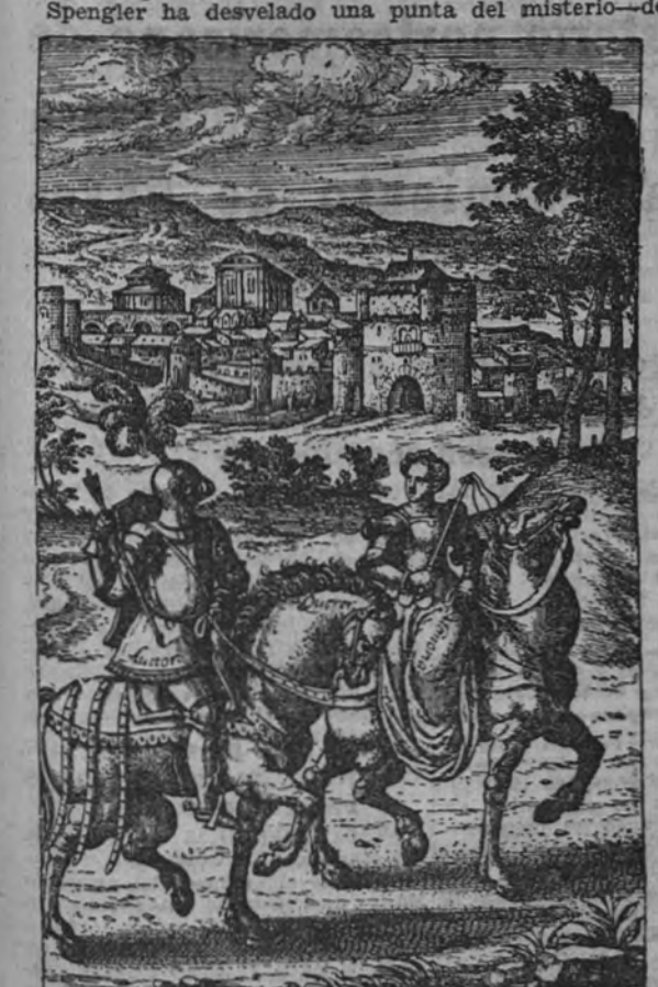
De éste, cuyo Imperio oculto, dará la divina mano clara proyección en aumento.

ESTAN por estudiar en la ciencia de la cultura las épocas de la esterilidad. Pero la mirada aguda puede sorprender en ellas no sólo hermosuras, esas que Platón prefería, las de luz seca y opaca, sino también significaciones profundas, porque cuanto acontece en la Historia tiene siempre sentido y es en cualquier caso signo de un alma. Ríase descubrió quizás un mundo enorme, un continente intacto, el día en que dijo que arte toda impotencia es creadora y, en cierto modo, voluntaria. Pero pocos, muy pocos, se han adentrado con talante de exploración y conquista por esas Indias de la recién nacida cultura. Spengler ha develado una punta del misterio—de