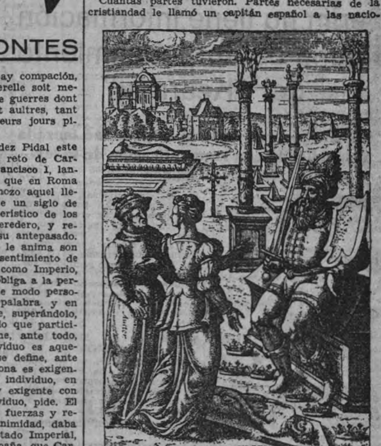
Cuando Memoria entendió el fin que yo pretendía. (Grabados de "El Caballero Determinado".)

Le gustaba al Emperador leer, en romance castellano, aquellas estrofas: Que el mundo, al cual ha privado Muerte de un bien tan entero, presto lo verá cobrado con el sucesor primero de esta corona y Estado. Por quien se podrá decir que no fué muerte el morir de estos siete que murieron, pues cuantos partes tuvieron tornen en él a vivir. Cuantas partes tuvieron. Partes necesarias de la cristiandad le llamó un capitán español a las naciones.