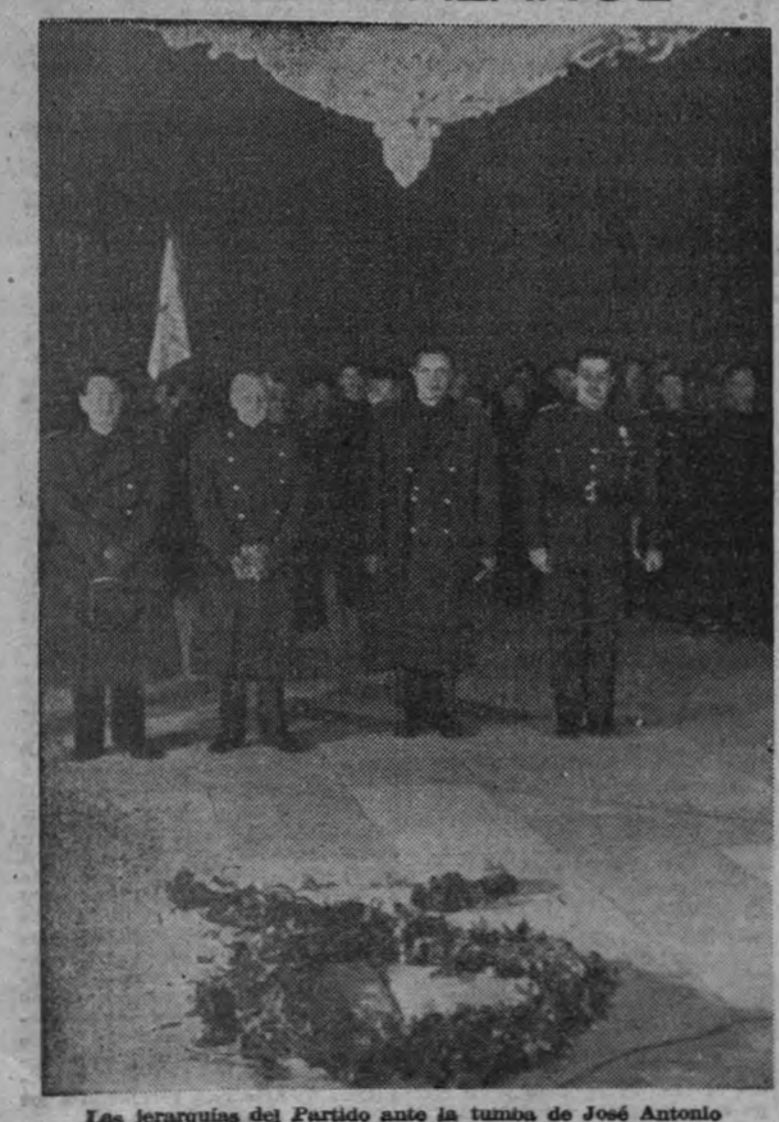
Las jerarquías del Partido ante la tumba de José Antonio

viaria Arkángel-Moscú; pero en los medios competentes de Washington se muestran muy escépticos sobre la exactitud de esta afirmación." (Efe.)