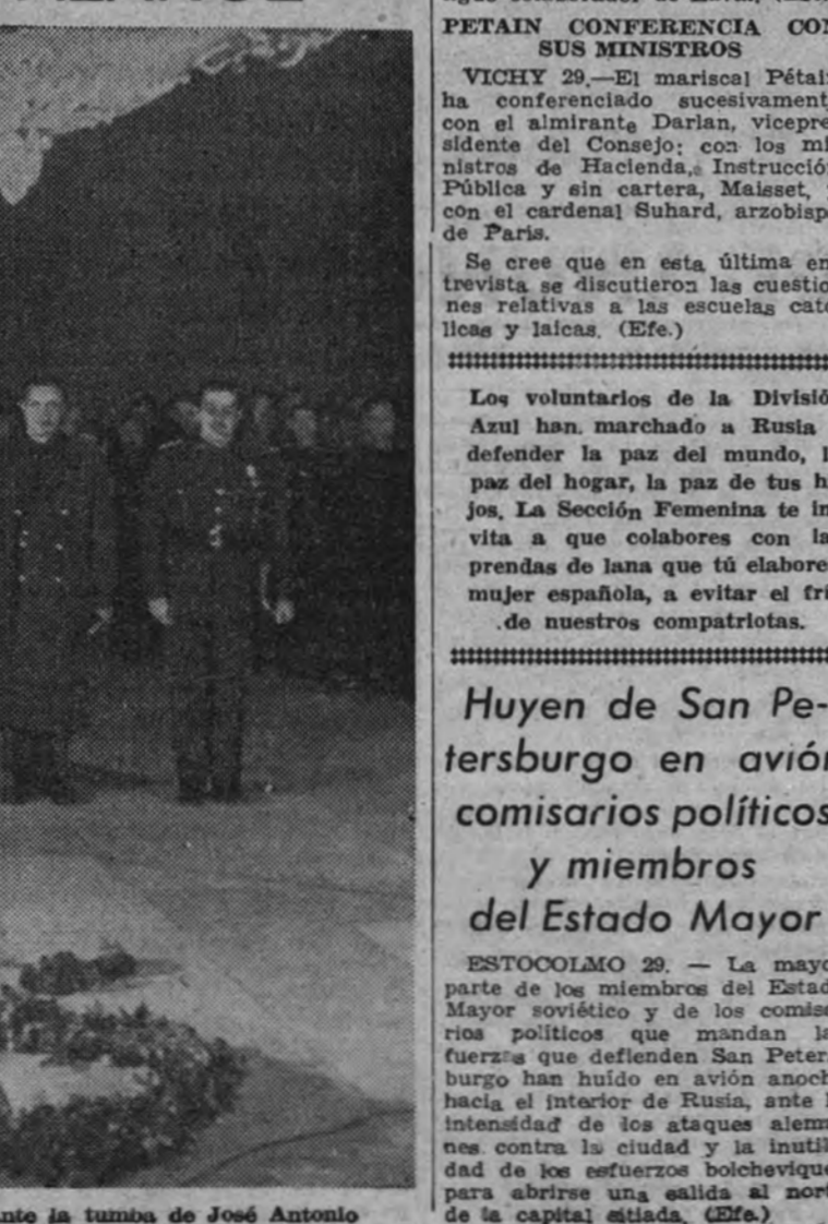
Las jerarquías del Partido ante la tumba de José Antonio