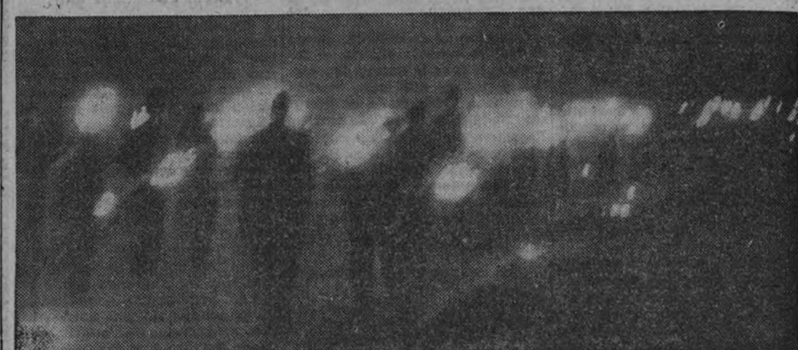
La Vieja Guardia, con antorchas, camino de la tumba de José Antonio en la noche de ayer.