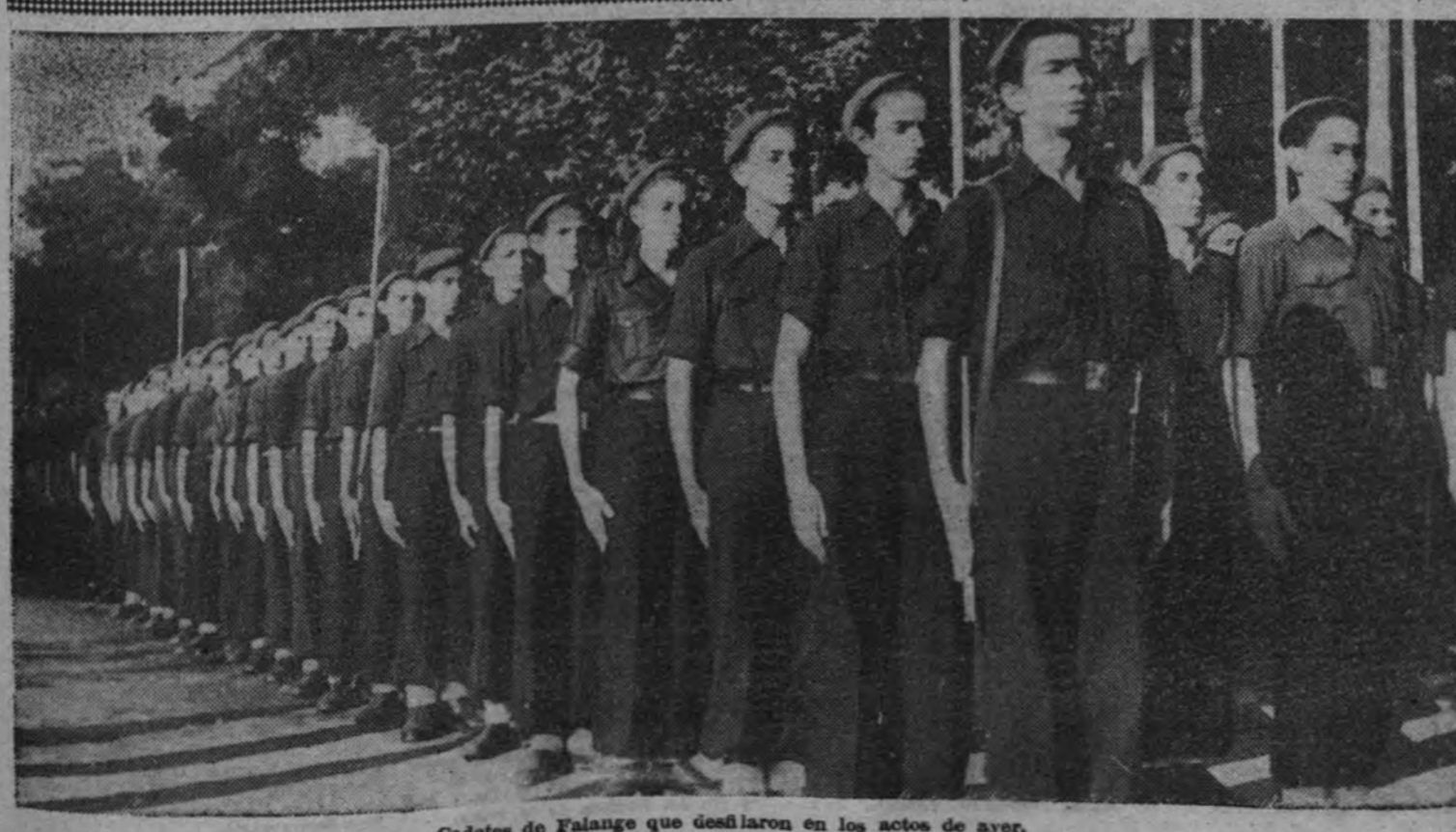
Cadetes de Falange que desfilaron en los actos de ayer.

LISBOA 29.—De dos millones de jóvenes norteamericanos reconocidos por los Tribunales de revisión del Ejército, la mitad ha sido declarada inútil para el servicio militar. Así lo anuncia el diario "O Século", el cual añade que 900.000 presuntos reclutas han sido eliminados por mal estado de salud o por deficiencias físicas o mentales, y los 100.000 restantes por falta de instrucción escolar. El periódico declara que estos resultados han causado mala impresión al Presidente Roosevelt, quien esperaba que fuese mucho mayor el porcentaje de hombres útiles. (Efe.)