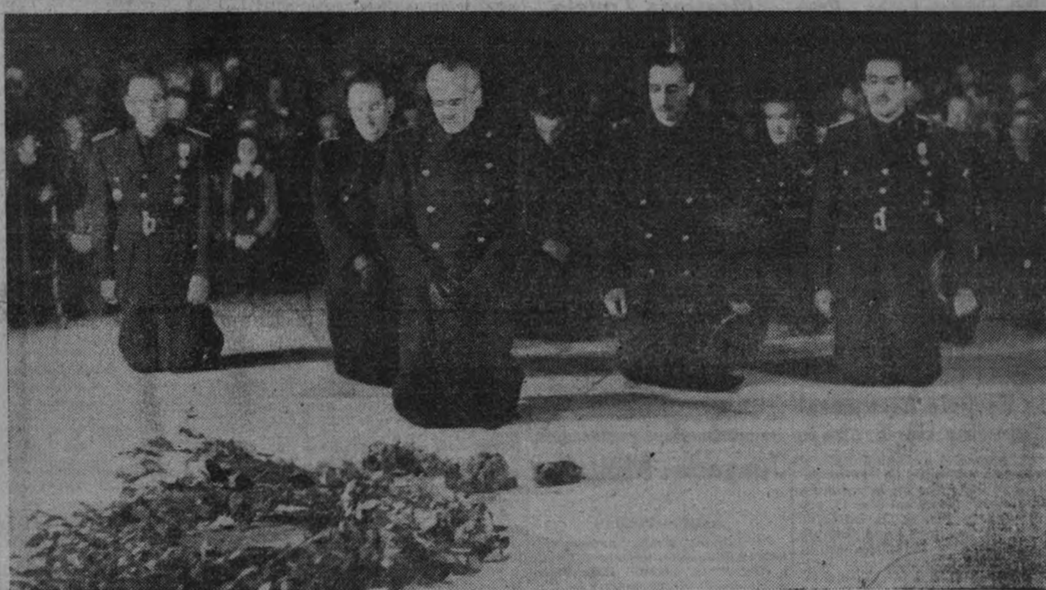
El ministro Presidente de la Junta Política y los ministros Secretario general del Movimiento, de Agricultura y de Trabajo, y el jefe provincial de Madrid, oraron ante la tumba de José Antonio después de la ofrenda.