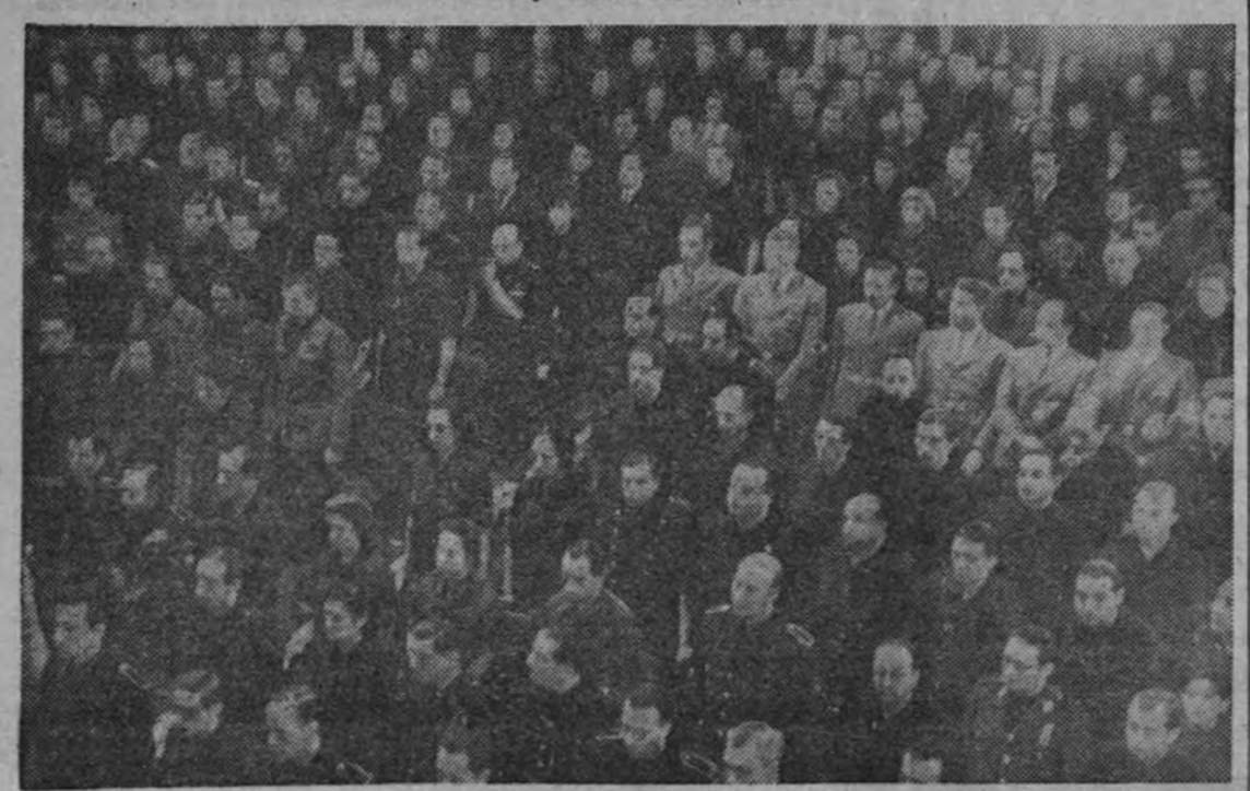
El público escuchó en pie la lectura del discurso fundacional. Representaciones del Fascio italiano y del Nacional-socialismo alemán, especialmente invitadas, figuran en nuestro grabado.