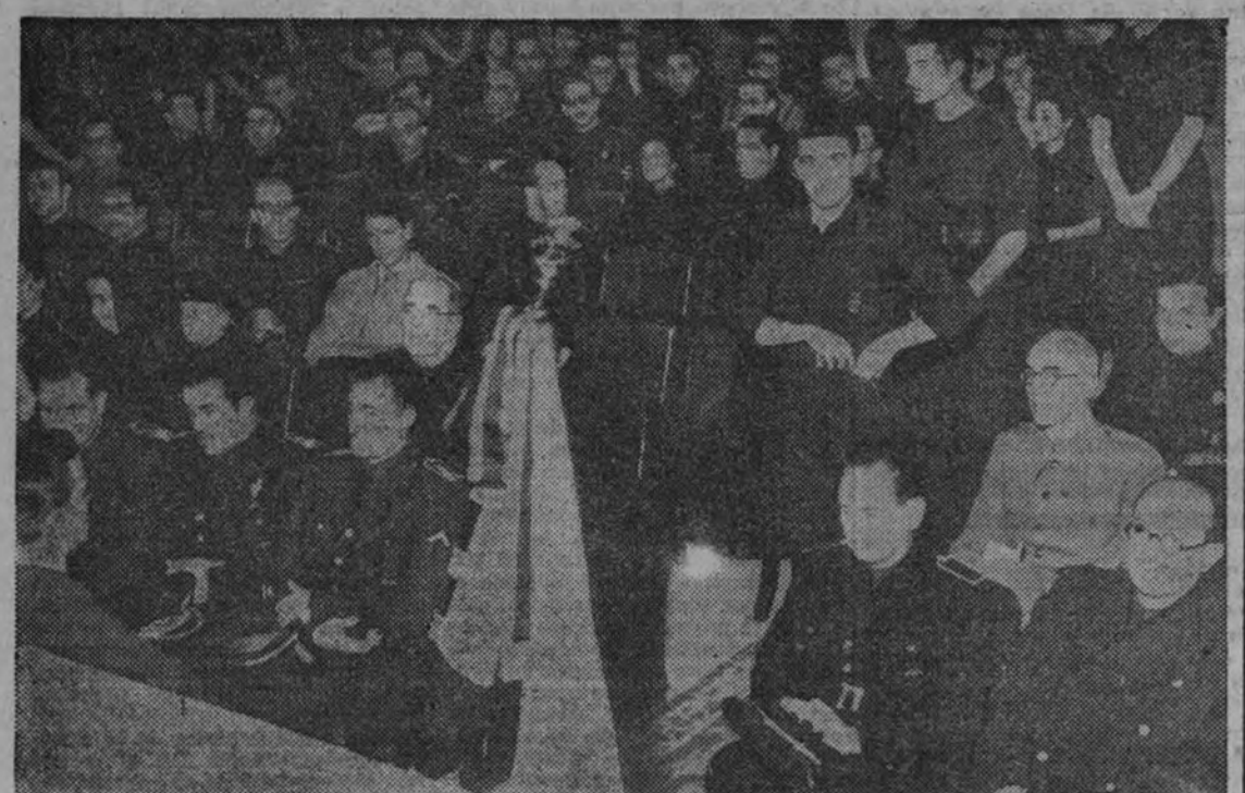
Antes de comenzar el acto conmemorativo de la Comedia, ocuparon asientos en la primera fila de butacas los ministros (de izquierda a derecha) de Industria, Trabajo, Agricultura, Secretario general del Movimiento y Educación Nacional.