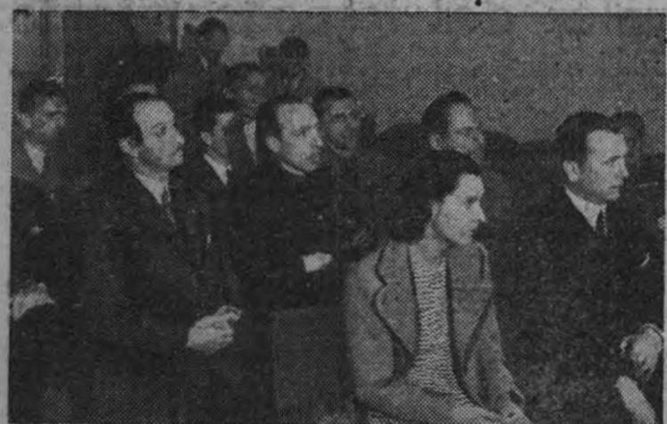
Los periodistas de la Escuela, a los que se les ha dado el carnet en la Vicesecretaría de Educación Popular.

"Camaradas: Se ha escrito este periódico por un escritor español, y con mala lengua y buena pluma, que fabricaban la Historia en Madrid, los periodistas, y en las alquerías y en los villorios, las marionetas aldeanas."