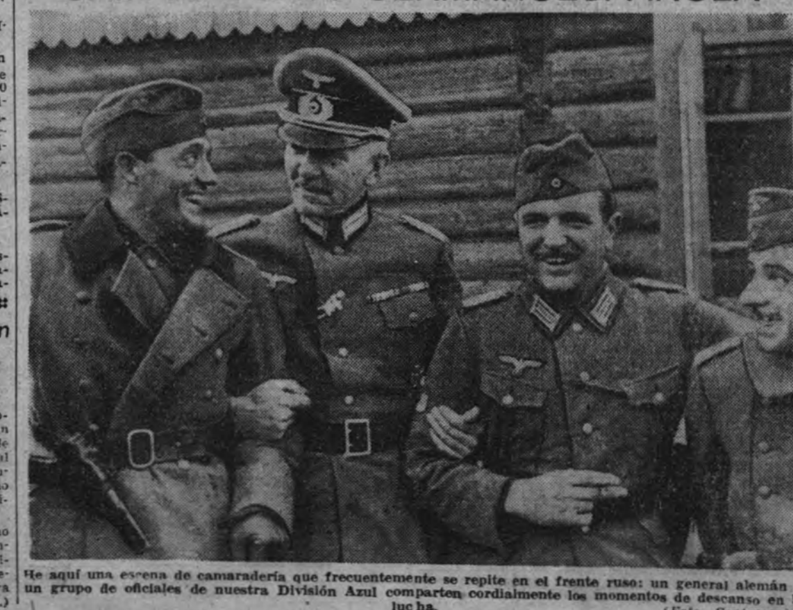
He aquí una escena de camaradería que frecuentemente se repite en el frente ruso: un general alemán y un grupo de oficiales de nuestra División Azul comparten cordialmente los momentos de descanso en la lucha.