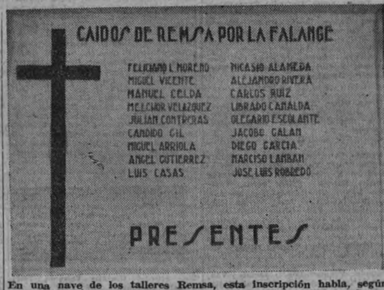
En una nave de los talleres Remsa, esta inscripción habla, según nuestro estilo, de los duros servicios realizados en todas las horas.