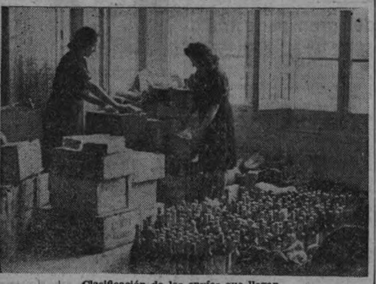
Clasificación de los envíos que llegan.

El homenaje del presente año a la madre española está exclusivamente dedicado a las de nuestros camaradas que voluntariamente luchan contra el comunismo en las filas de la División Azul de la Falange.