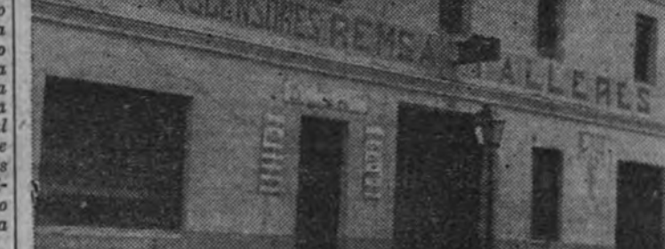
Fachada de Remsa, en la que campea orgulloso nuestro emblema, tan arduosamente defendido.

Remsa tenía, por ejemplo, a su cargo la guardia personal de José Antonio dos o tres veces al mes. El hotel de Chamartín se vio muchas veces custodiado por los agu-