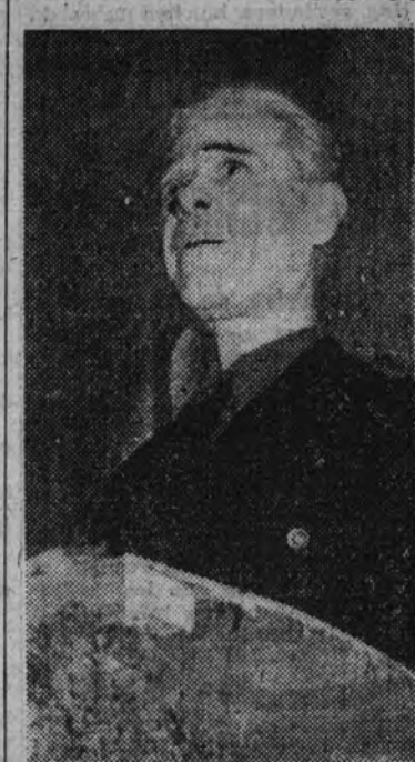
El vicesecretario del Partido pronunciando su discurso

Al final de la jornada se rindió homenaje ante la tumba de José Antonio