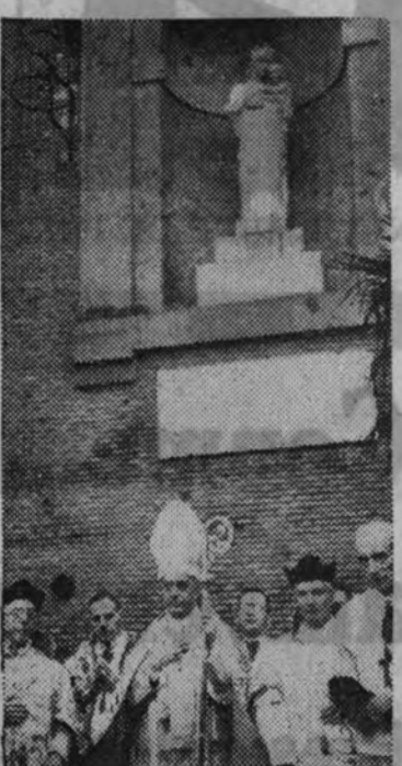
El obispo de Madrid-Alcalá en el momento de la bendición de la Virgen de la Almudena

Una verdadera muchedumbre de fieles formó en la procesión y presencié el desfile desde las aceras y los balcones.