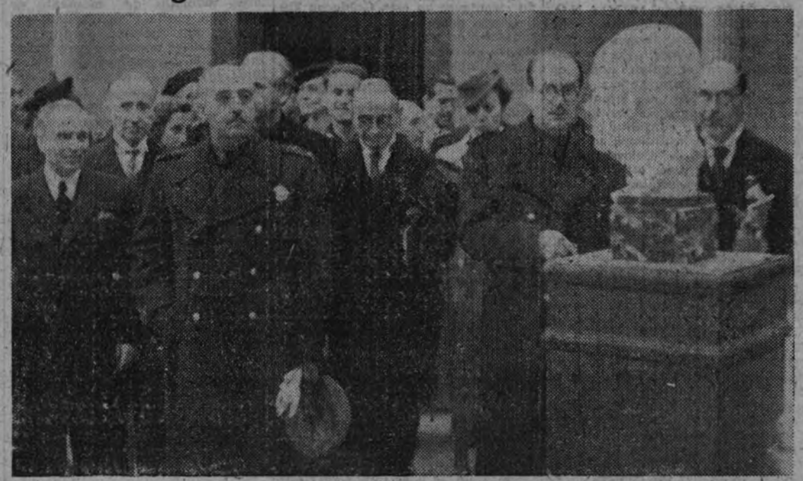
El Caudillo recorre las salas de la Exposición Nacional de Bellas Artes, cuya solemne inauguración presidió ayer.

El Generalísimo fué largamente aclamado por el público