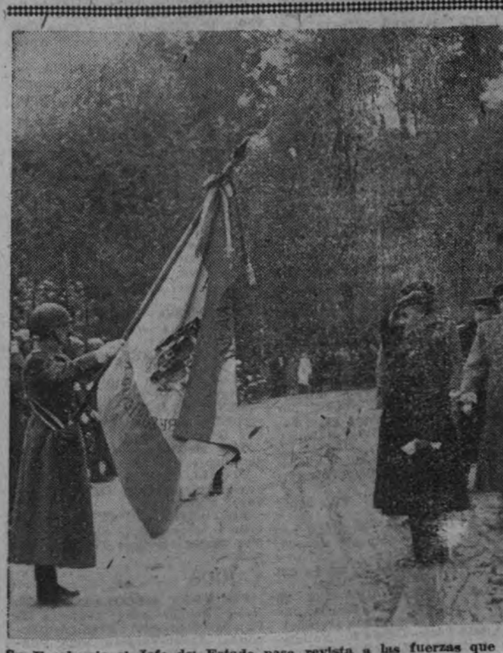
Su Excelencia el Jefe del Estado pasa revista a las fuerzas que le rindieron honores ante el edificio donde se celebra la Exposición Nacional de Bellas Artes.

Para España será amargo, duro y tremendo el trance si llega el Gobierno cubano—por democrática imposición de su Parlamento, claro es—a esa clausura de Consulados, que sería arrojar a los peligros más graves de la libertad en libertad a los españoles de Franco que viven en Cuba. Tan amargo, duro y tremendo como es confortador saber de antemano de otros pueblos hispánicos de América dispuestos a ofrecerse, si ese día llega, para proteger con sus pabellones amigos, nobles y bien queridos, los intereses de España en Cuba, que—no ciertamente por lo material—nunca podrían quedar a la intemperie.