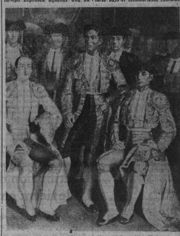
Fragmento del cuadro "Las cuadrillas de Lagartijo, Frascuelo y Mazzantini", del pintor Daniel Vázquez Díaz.