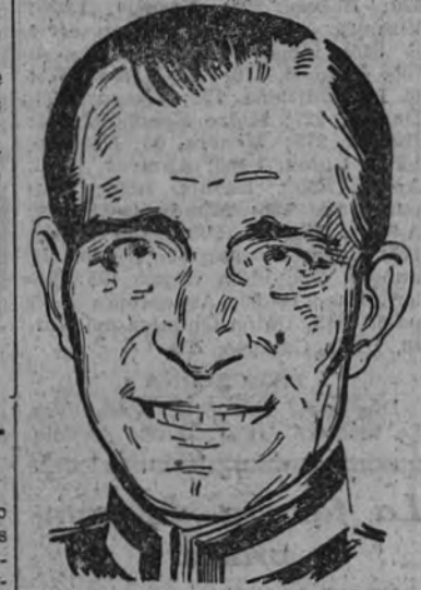
Maund, comandante del "Ark Royal".

Se trata, como se sabe, del tercer portaaviones inglés hundido: el primero, el "Courageous", lo fue en otoño de 1939, y el segundo, el "Glorious", cuando la evacuación de Narvik. Agregó el ministerio de Información que el "Ark Royal" salieron los aparatos que atacaron al "Bismarck" en el mes de mayo último. La primera vez se le dio por hundido en la batalla en el "Grave Spot". Había intervenido en numerosas acciones importantes, tanto en la guerra naval de Narvik como posterior-