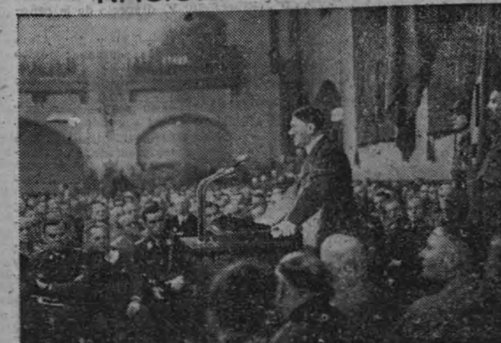
En el marco ya tradicional de la cervicería de Munich, el Führer, reunido con sus primeros colaboradores, pronuncia, en la noche anterior al 9 de noviembre, el discurso de conmemoración de la Marcha Nacional Socialista.

HITLER CONMEMORA LA MARCHA NACIONAL SOCIALISTA