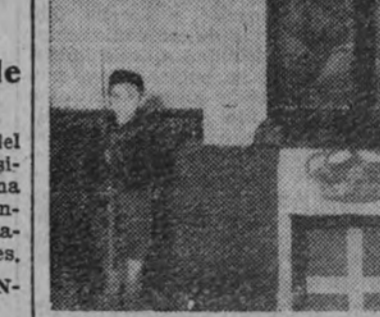
En el salón de actos de la Casa del Fascio italiano se verificó el pasado domingo a mediodía el acto conmemorativo de la Marcha sobre Roma.

Seguidamente, el consejero nacional de Italia, que presidía, habló en forma vibrante sobre el contenido social-político, y sobre todo espiritual, que anima la acción de las potencias que luchan por el nuevo orden en Europa, y afirmó que este orden nuevo se basa en la justicia.