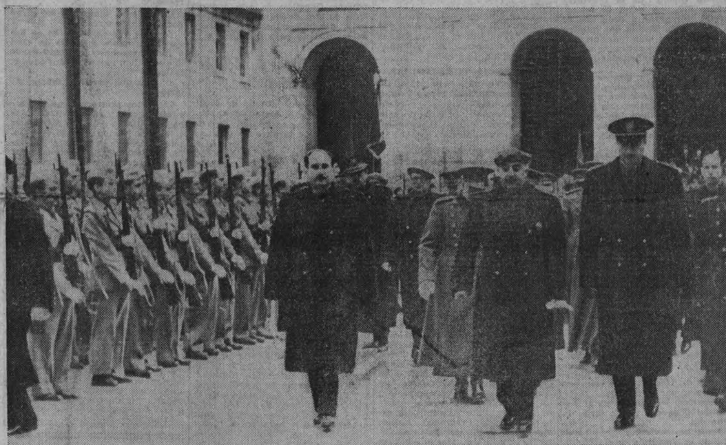
El Caudillo, acompañado por el ministro Secretario, camarada Arrese, y el de Agricultura, camarada Miguel Primo de Rivera, atraviesa el patio de Reyes entre las centurias del S. E. U., que le presentan armas.

A las diez y media de la mañana llegó la centuria de Trabajo de A. C. N. S., quien montó guardia en el pabellón de entrada al Monasterio.