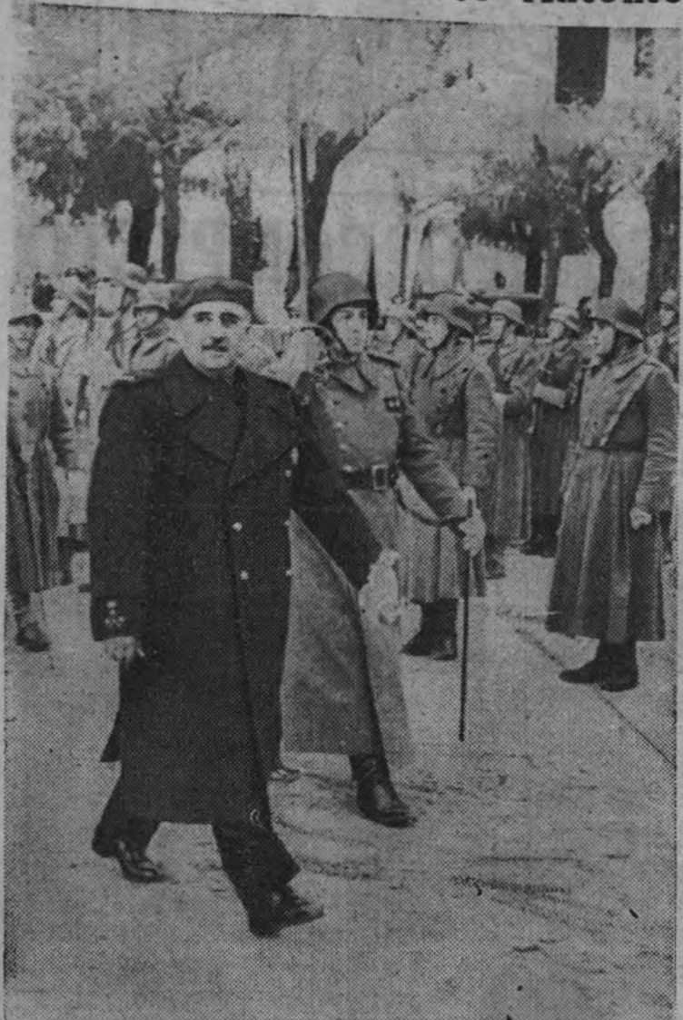
A su llegada a El Escorial, el Caudillo pasa revista a las fuerzas militares que le rinden honores.

En Francia había cien mil masones, de ellos ocho mil quedan incluidos en el decreto de incompatibilidades