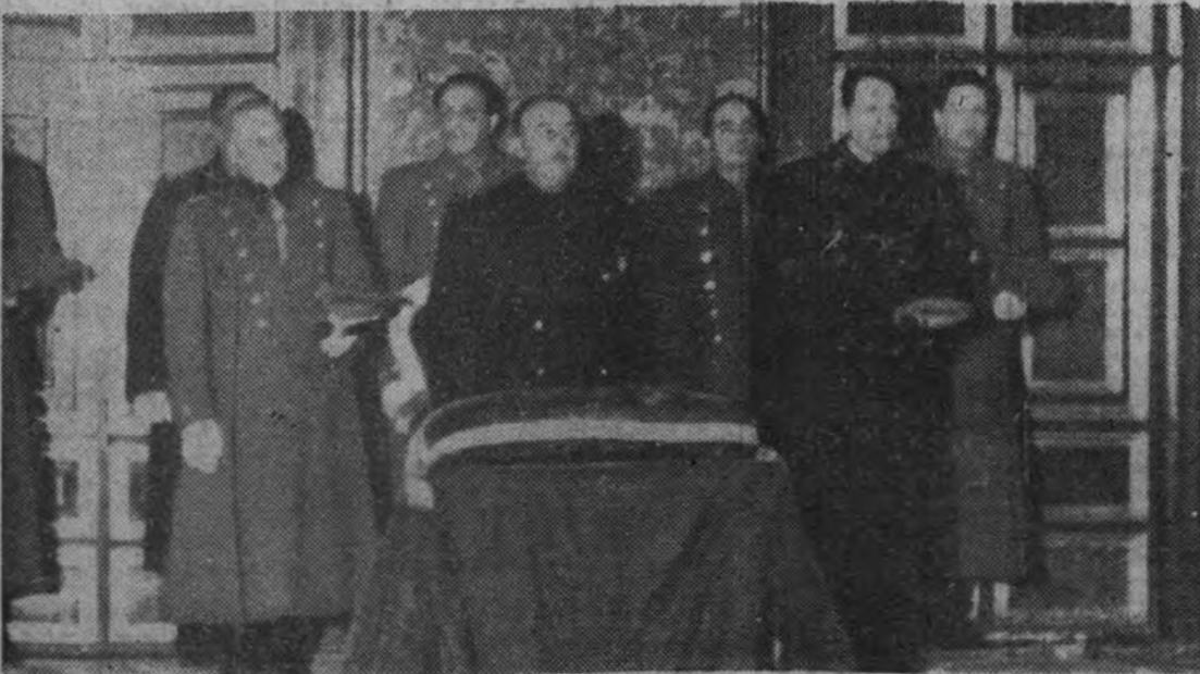
El Caudillo, desde el lugar del presbiterio correspondiente al Evangelio, preside la ceremonia religiosa

Si con José Antonio se hubieran muerto los problemas y las angustias de nuestra generación de combate y de una nación puesta en el cruce de mundos enteros en lucha, acaso podríamos sestar líricamente en discursos y endechas. Tenemos que vivir erguidos sobre el tiempo, y las campanas funerarias que cada noviembre nos traen al alma el recuerdo y la voz de José Antonio nos obligan a una tensión revolucionaria y permanente. Es, además, la orden de Franco lo que más hondamente cada día habrá de imprimir al tiempo nuevo el pensamiento y la doctrina de José Antonio. Es nuestro Jefe nacional el que nos proclama ante la tumba del Fundador de la Falange la necesidad de dotar a nuestras escuadras de una continuada y disciplinada acción. Sólo así justificaremos ante Dios y España la hermosa vida hecha hoy piedra bajo la mejor arquitectura de la Patria.