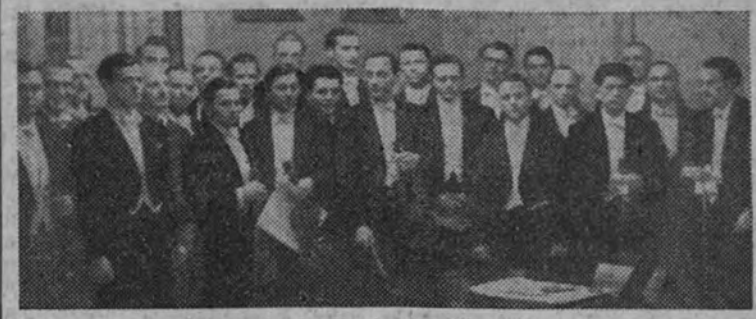
Orquesta berlinesa de Cámara