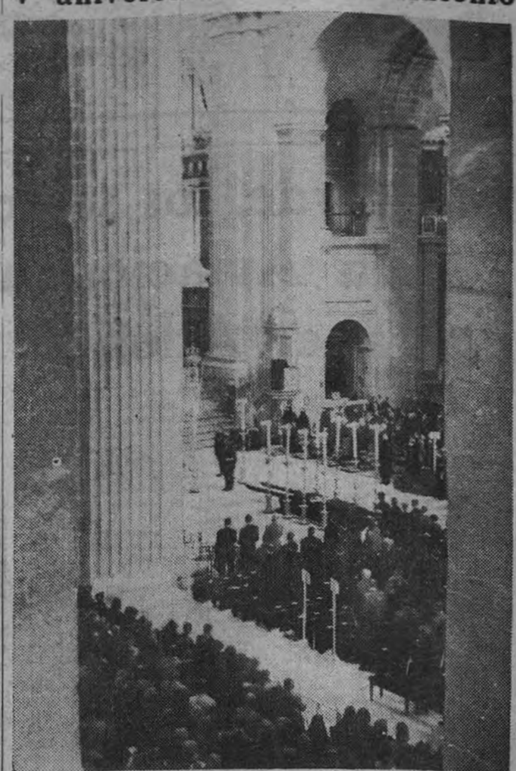
Un aspecto de la Basílica durante la celebración de la ceremonia religiosa.

servir el propósito ambicioso por el que cayeron, para entrar otra vez por las rutas de la gran historia y para servir en la universalidad el destino de España."