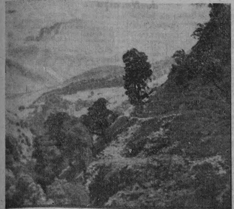
Paisaje, de Núñez Losada