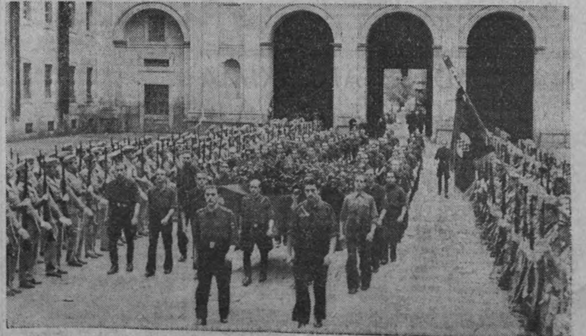
A hombros de la Vieja Guardia entra en el Monasterio la gran corona de laurel que hasta la tumba de José Antonio han conducido a pie sus primeros camaradas