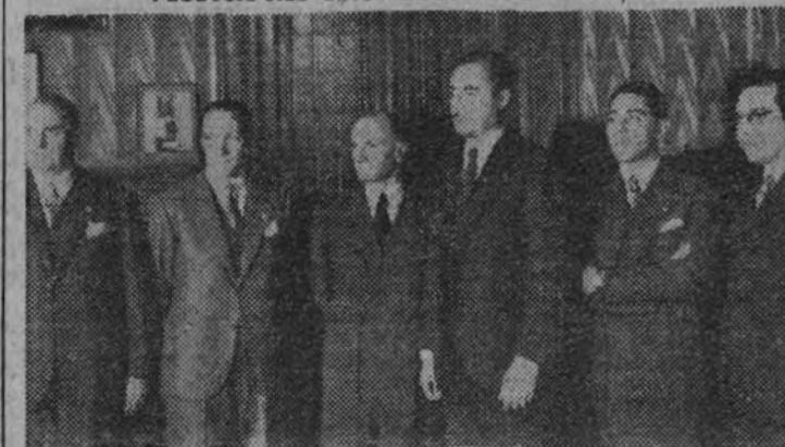
El ministro de Agricultura, camarada Miguel Primo de Rivera, recibe a la Comisión científica italiana acompañada por el embajador.

Invitadas por el ministro de Agricultura, visitarán las zonas olivícolas