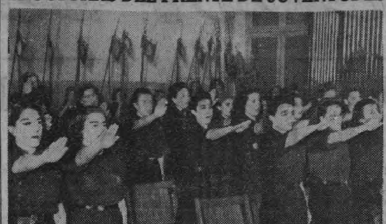
Las nuevas instructoras del Frente de Juventudes cantaron el "Cara al Sol" al terminar el acto.