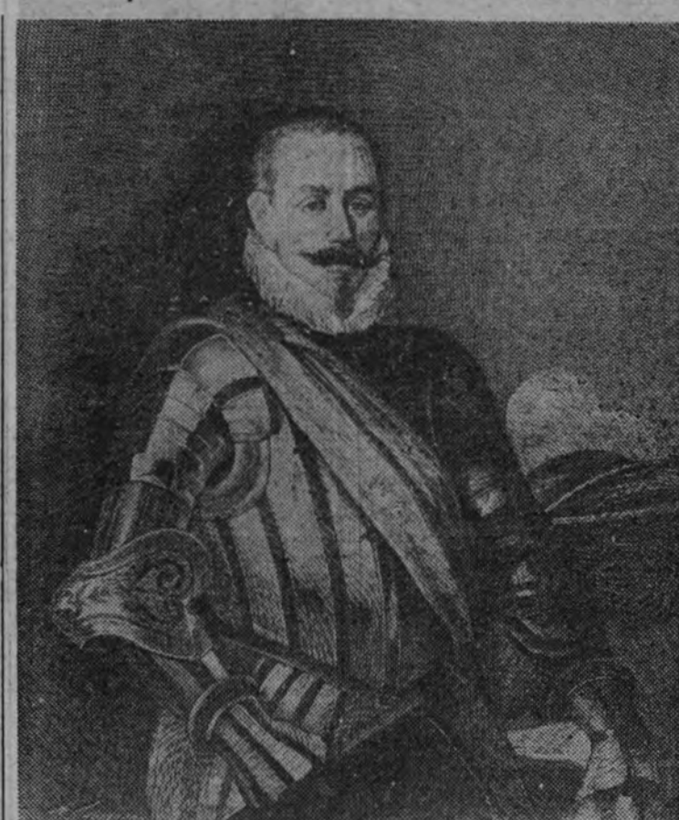
Francisco de Orellana según un grabado del siglo XVII.

Juan de la Cosa recogió la noticia del hallazgo al montar su mapa-mundi, en 1501, llamándole "Mar dulce", que frecuentemente fue llamado también "río Marañón". Hubo quien con firmeza se atuvo a esta última denominación, hasta el punto que