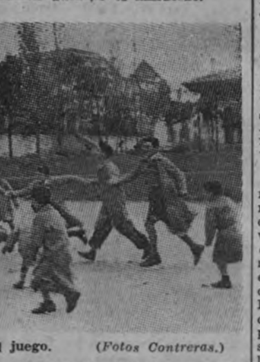
La hora del juego.