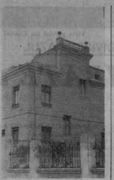
Edificio de la Institución.

Durante el verano, algunos de los chicos han pasado sus vacaciones en el Campamento del Frente de Juventudes "Juan de la Cosa", en Laredo (Santander), y los demás han marchado a sus casas,