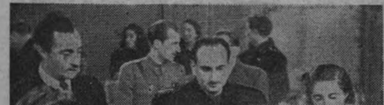
El ministro Secretario general, acompañado de Pilar y Miguel Primo de Rivera, inspecciona la labor de las camaradas de la Sección Femenina.

después de la compra de víveres y géneros, hay algún sobrante, se entregará donativos de 100 pesetas a las familias más necesitadas de los combatientes. El ministro de Agricultura dirige un saludo a los heroicos camaradas El ministro de Agricultura pronunció unas palabras para el Noticiero Ufa, en las que dirigió un saludo a las camaradas de la División Azul, diciéndoles que en España, la Sección Femenina de la Falange, una vez más, ha demostrado que las cosas pueden hacerse rápidamente y con disciplina. "Estos donativos de toda España, que distribuye la Sección Femenina—dijo—, os compensará en parte de los frios y sacrificios que estáis pasando en las inhóspitas tierras de Rusia. Con ellos, todos los hombres, todos los camaradas, os enviamos nuestro aliento y nuestro empuje para que redobléis vuestros esfuerzos en el cumplimiento de lo que es un deber de españoles en España. Arriba España!" El ministro Secretario general felicitó a la delegada nacional El Secretario general del Partido felicitó a la delegada nacional de la Sección Femenina por el trabajo intenso y el celo que todas y cada una de las camaradas ha puesto a contribución para organizar rápidamente el envío de los donativos a los heroicos combatientes. DONATIVOS RECIBIDOS POR EL MINISTRO DE ASUNTOS EXTERIORES El excelentísimo señor ministro de Asuntos Exteriores ha recibido en el día de ayer, con destino al