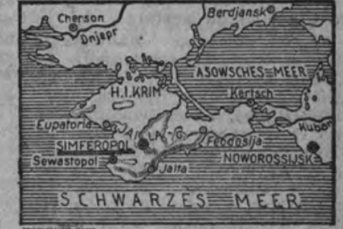
Mapa de Crimea. La División Española de Voluntarios.

La infantería española. El parte de guerra alemán de 30 de octubre comunica, entre otras cosas: "En el sector Norte la 'División azul' española en un ataque envolvente ha tomado varias posiciones capturando, de nuevo, numerosos prisioneros."