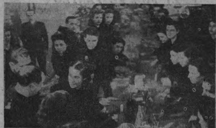
A la llegada del ministro Secretario general, la delegada nacional de la S. F. cumple su turno de trabajo.

La delegada nacional participa en las tareas en el turno de noche