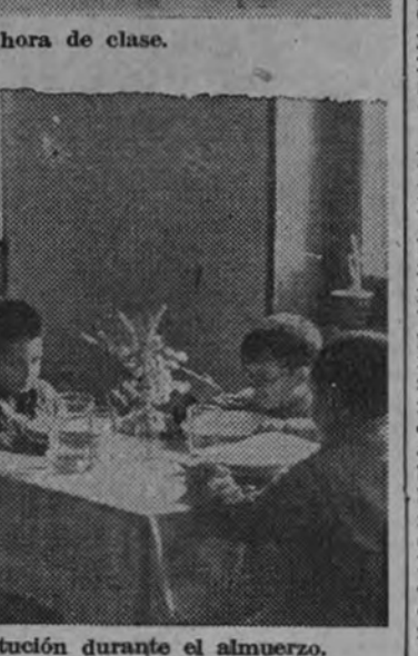
Los niños acogidos a la Institución durante el almuerzo.