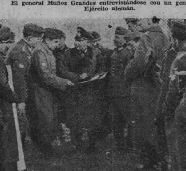
El general Muñoz Grandes estudiando el plano de situación de las fuerzas alemanas que iban a ser relevadas por la División Azul.