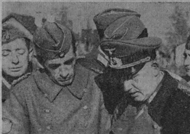
El general Muñoz Grandes entrevistándose con un general del Ejército alemán.