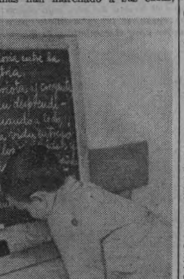
Un niño en la hora de clase.

A los efectos de su educación, como los muchachos son de edades muy diferentes, se han hecho dos grupos: uno para los que siguen la enseñanza elemental y el otro con los que cursan ya el bachillerato. La enseñanza religiosa es