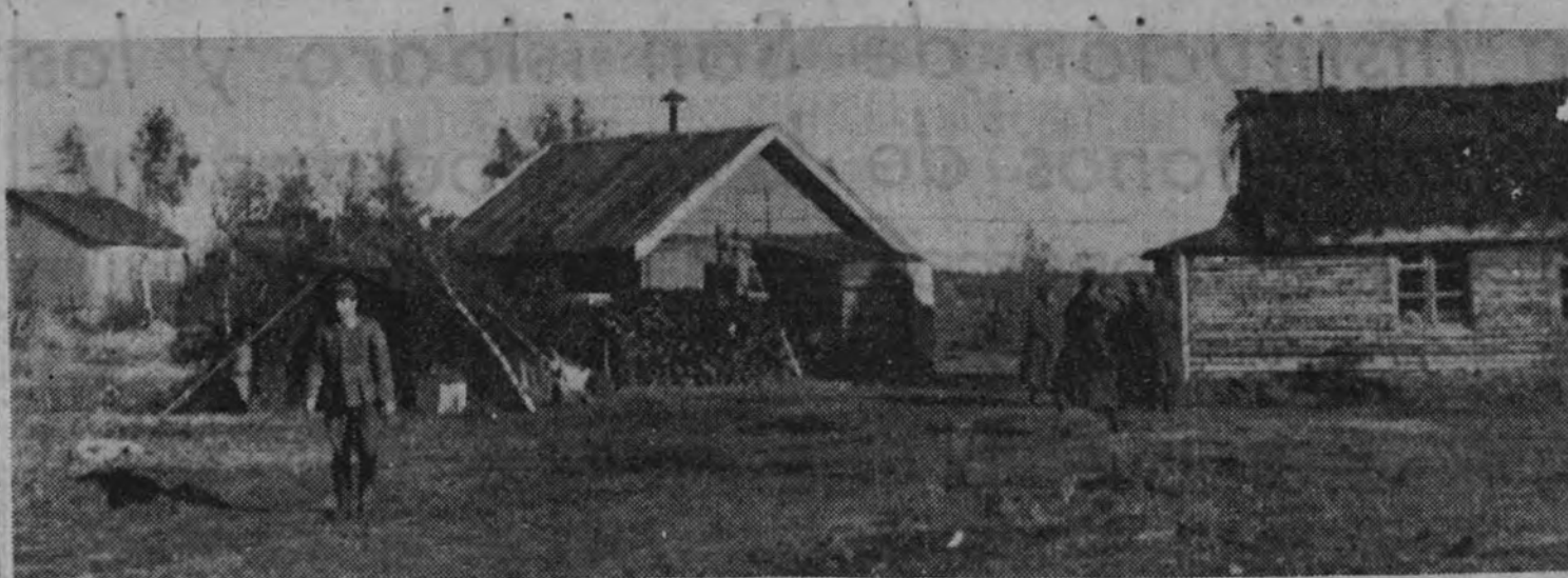
Vista parcial del Cuartel General de la División

El tiempo en Castilla es un lago tranquilo que no siempre refleja escudillas de ángeles bogando por el azul de la mañana. Vigilemos este silencio y esta calma. Pongámonos en ellos un tiempo de acciones, de quehaceres y de esfuerzos. No sea que las gentes se pierdan tan sumergidas en una eternidad real y no meramente poética, que se sientan como petrificadas y muertas. No sea que la hierba lusa de aquella ventanilla pueda más que el gigantesco sacrificio de las generaciones y que la misma salvación del gran destino de la Patria.