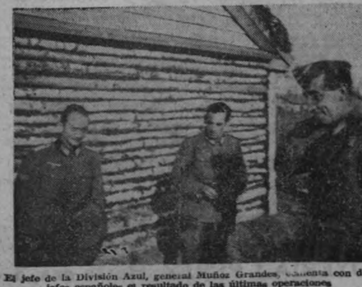
El jefe de la División Azul, general Muñoz Grandes, con dos jefes españoles en el resultado de las últimas operaciones.

Estamos en la época más definitiva y honrosa de la Falange, y todos nuestros nervios deben de aplicarse en la tarea de reconocernos los unos a los otros como seres capaces de poner sus manos en el destino firmísimo de España. El período bélico, como predominio glorioso, vital e inexcusable de la acción militar, representa un período de política más deficiente y menos experimental. Hemos superado la etapa inicial que ayer marcábamos, y la voluntad de Franco dispone que en la Falange que ordena sólo queden los necesarios y los fervientes.