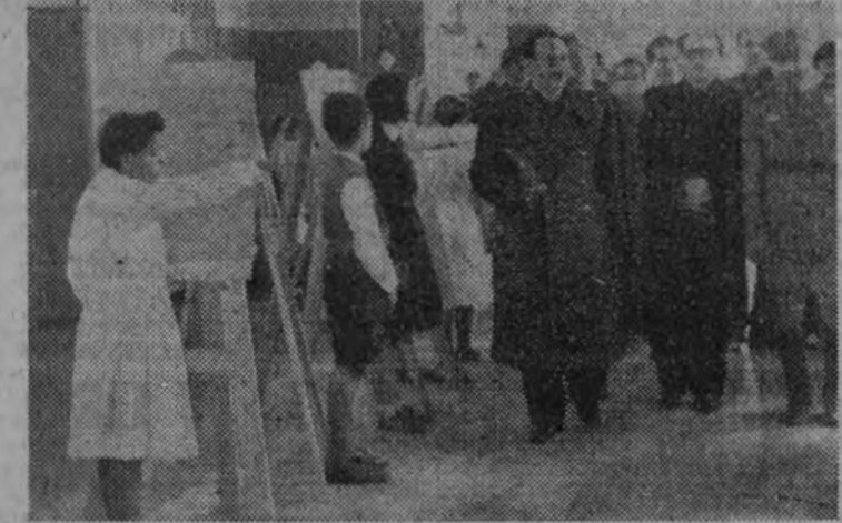
Los ministros Secretario general del Movimiento y Educación Nacional, con el general Rada, en su visita a la fábrica de cerámica.

El obispo de Madrid-Alcalá bendijo los edificios reconstruidos