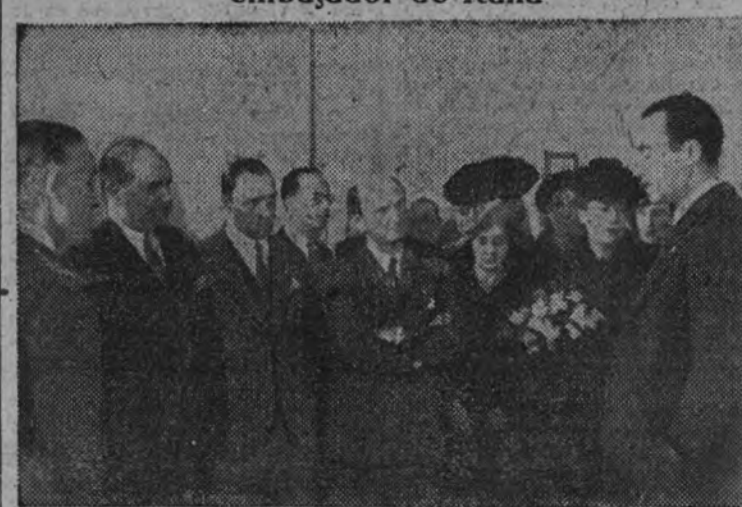
El ministro de Agricultura, camarada Primo de Rivera, con los técnicos italianos.

Hablaron el ministro de Agricultura y el embajador de Italia