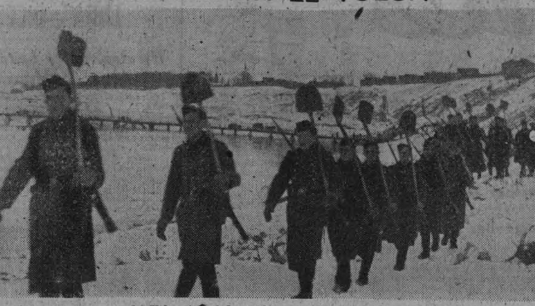
A lo largo del alto curso del Volga, trabajadores alemanes, encuadrados en el Servicio Nacional del Trabajo, se esfuerzan por mantener abiertas las vías de comunicación que la lluvia ha convertido en barrizales.