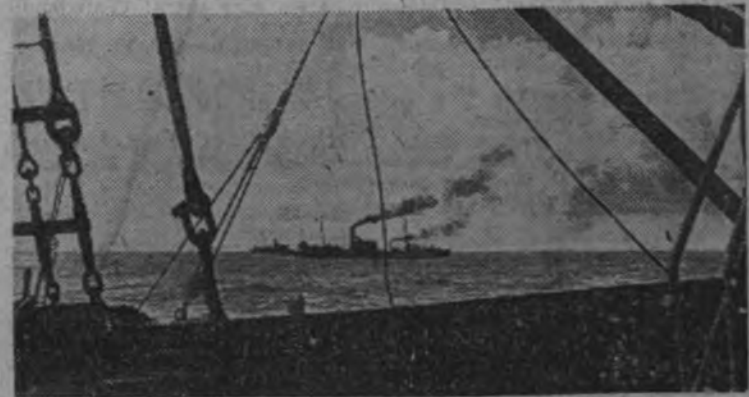
Patrulla de submarinos alemanes recorriendo el mar del Norte en servicio de reconocimiento para limpiar de minas enemigas aquellos parajes.

"Las concentraciones de tropas soviéticas en Rostov han sido materialmente destrozadas por la Aviación", se dice en Moscú