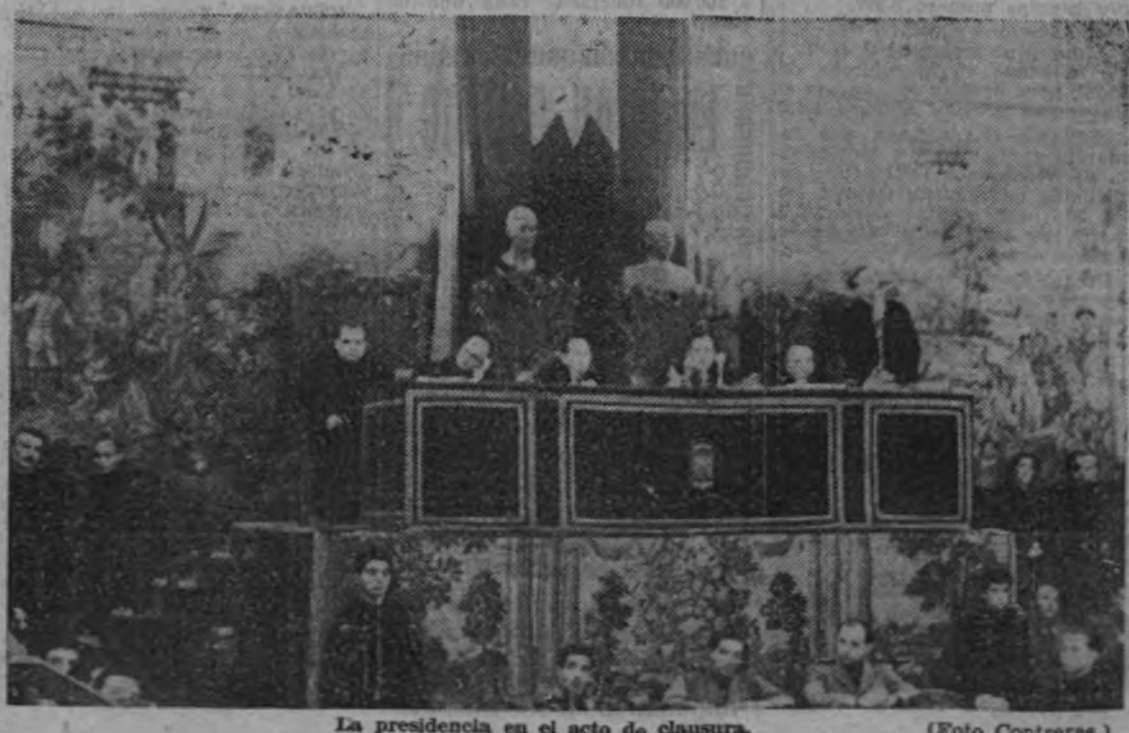
La presidencia en el acto de clausura.

A partir del próximo año, ARRIBA publicará los domingos un suplemento de carácter monográfico dedicado siempre a temas de importancia nacional y extranjera, tanto políticos como técnicos, artísticos o literarios. En él colaborarán los escritores y periodistas más destacados en cada especialidad, y será ilustrado por los mejores pintores y dibujantes de España.