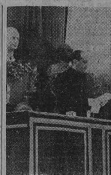
El ministro Secretario pronuncia su discurso.

ser la labor de la Falange, ya comprendida por el ministerio de Educación Nacional; liberar a la Universidad de la costra que le asfixia, no consentir que quede reducida a una fábrica de títulos académicos o, en el mejor de los casos, a una fábrica de ciencia a presión.