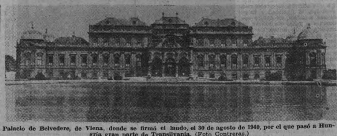
Palacio de Belvedere, de Viena, donde se firmó el laudo, el 30 de agosto de 1940, por el que pasó a Hungría gran parte de Transilvania.

"En Budapest se observan ciertos síntomas reveladores del modo realmente notable de cómo entienden la solidaridad de las naciones que luchan en común contra la Rusia soviética determinada a destruirlos. Estas observaciones se refieren, especialmente a Rumania. El 30 de agosto de 1940 Hungría y Rumania aceptaron el arbitraje sobre la cuestión transilvana que habían formulado los representantes del Eje en el Palacio de Belvedere, de Viena. Hungría recuperó una parte de aquellos territorios, que durante mil años habían formado parte integrante de la Corona de San Esteban, hasta que el tratado de Trianon los arrancó del cuerpo húngaro para incrustarlos en el rumano. Después del laudo de Viena pudo leerse, principalmente en las Presas alemana e italiana, que por fin, se había reparado en parte la injusticia de Trianon, y que ya no había obstáculos para un amistoso entendimiento entre Rumania y Hungría. Ya en aquella ocasión algunos observadores neutrales mostraron su escepticismo sobre el particular. Pronto había de verse que llevaban razón. En Rumania surgió, inmediatamente después del laudo de Viena, un movimiento irredentista que no tardó en provocar graves perturbaciones internas que fueron causa de la caída del Gobierno de Gurgu y