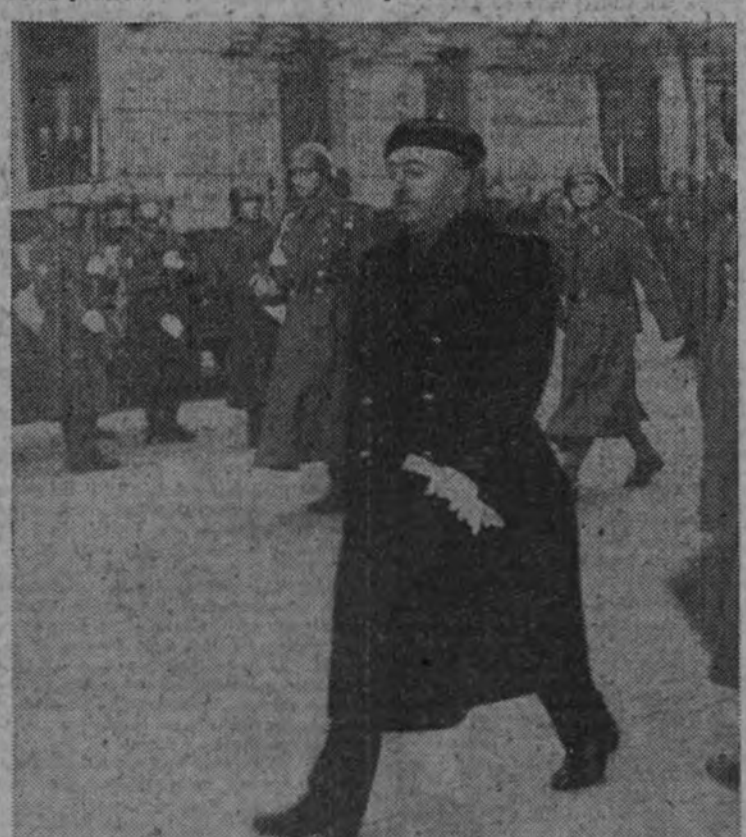
El Caudillo pasa revista a las fuerzas que le rindieron honores a su llegada al Consejo de Investigaciones Científicas.

Ante el estrado se hallaban el Nuncio de Su Santidad y los representantes diplomáticos, y junto a éstos el agregado cultural de la Embajada alemana, director del Instituto Italiano de Cultura y otras representaciones. En otros lugares se hallaban los consejeros nacionales, secretario del Consejo de la Hispanidad, jefe de Relaciones Culturales del