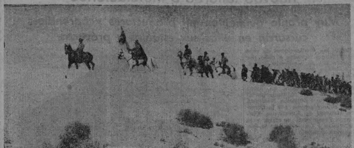
Una escena de la película "Harka", producción española.

Con la exhibición de películas nacionales en todas nuestras salas cinematográficas en proporción mínima de una semana dedicada al material nacional por cada seis semanas de proyección de películas extranjeras, y la obligación de completar los programas con una película española de corto metraje; con la creación de un Crédito Cinematográfico, que hará préstamos, libres de todo interés, a cuantos produzcan películas españolas; con la