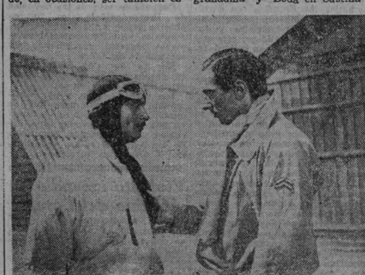
"Escuadrilla", película nacional

Conviene insistir en que el cine es reflejo de costumbres y puede, en ocasiones, ser también es-