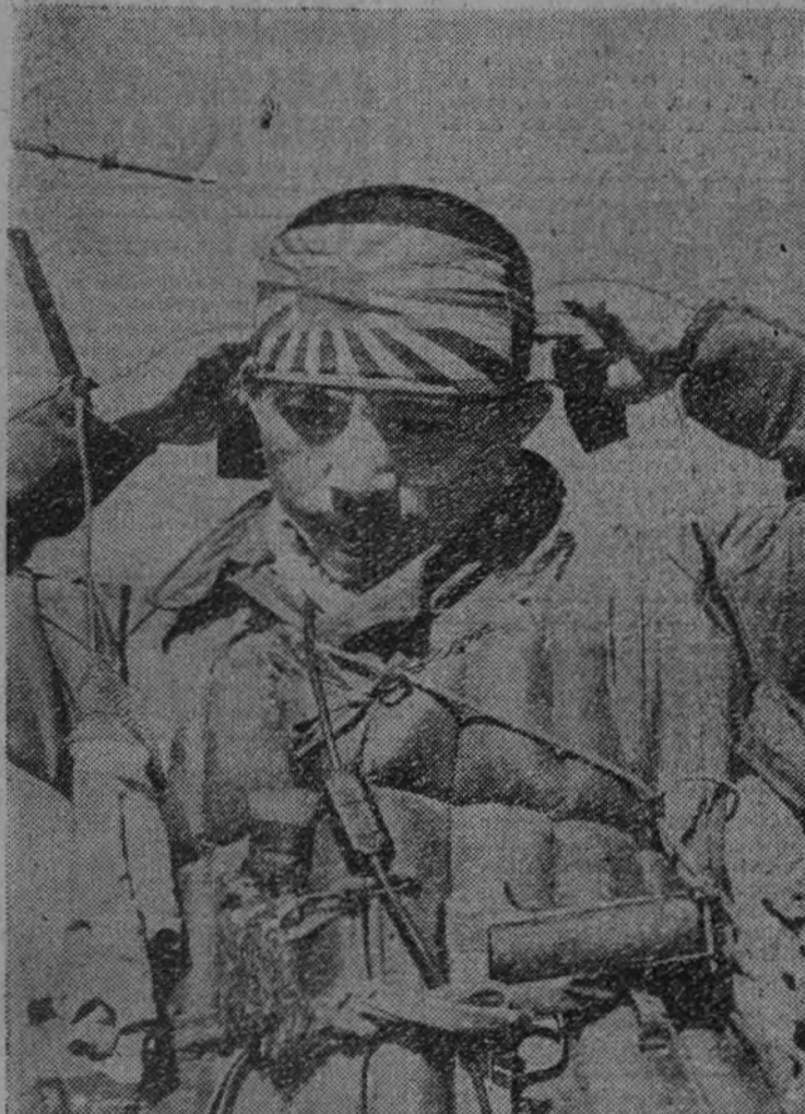
Un joven japonés del Ejército del Aire nipón, se dispone a tomar el avión para intervenir como paracaidista en las operaciones sobre la isla de Luzón.