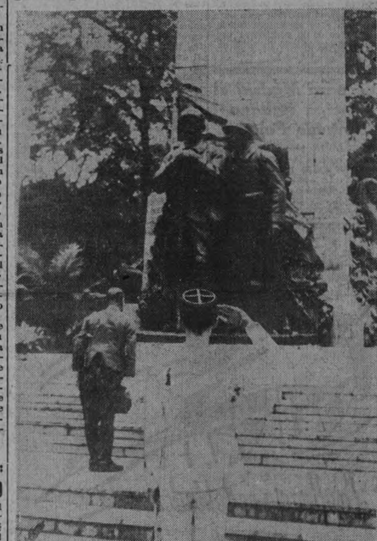
A su llegada a Saigón, el general japonés Shojiro Iida rinde homenaje ante el monumento a los héroes.