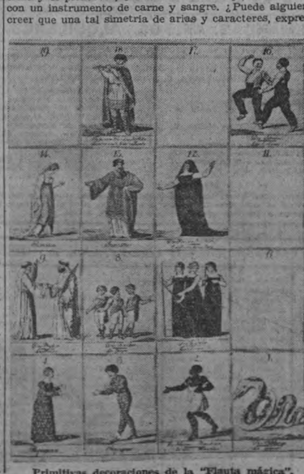
Primitivas decoraciones de la "Flauta mágica".

Mozart sabe también de otra clase de risa: la que disiente y pinta hasta el fondo un mundo herido. ¿Maldito: Don Juan, otra burla a Da Ponte. De un ruidón de bajos fondos, libertino sin grandeza, Mozart saca el milagro de una pintura exacta, concreta y directa de una serie de personajes que, desde la pura música, ingresan en la mejor escultura. Por esto, porque es una obra que crea un mundo cerrado y perfecto, la simplicidad llega al puro hueso. Don Juan muere, toda la obra parece esperar ese momento en que el no arrepentimiento es la única grandeza posible—¡Máxima de ese ahogado final para corazones rosas!—, y cuando todo podía hacer presentir acumulación de elementos que alcan el grito, he aquí cómo una orquesta sencillísima, unas escalas de violines sobre acordes simples, plasma para siempre la mejor caracterización de la desesperanza. Es éste el mismo que crea "Cosí fan tutti", esa risa casi cruel por su cristalina pureza, por su juego con la nuda ficción. En todos los matices de ellas, el imperativo de la voz humana—¡si hasta las trompas en la orquesta mozartiana se enamoran del trino y el picado!—ese triunfo del dibujo, de la línea con un instrumento de carne y sangre. ¿Puede alguien creer que una tal simetría de arias y caracteres, expresados siempre en voz como gorjeo merecerá el calificativo de insincera?