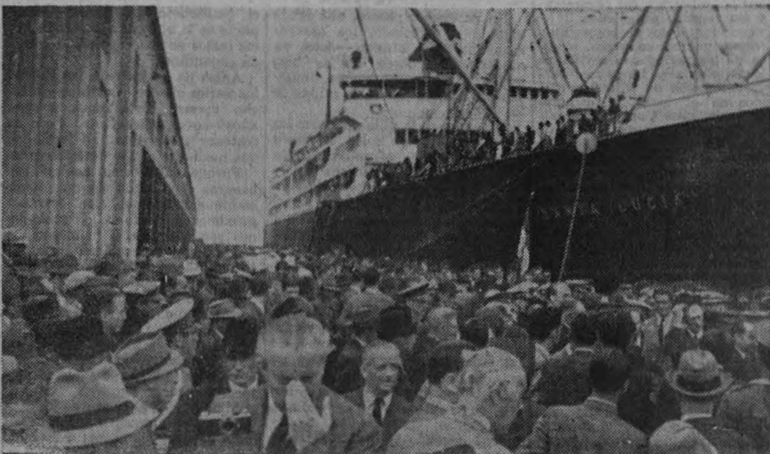
Un público numerosísimo ha acudido a los muelles a esperar a la Delegación española.

El próximo día 28, el pueblo de Azcoitia tendrá un gran homenaje al P. Otaño, con motivo de habersele concedido la Gran Cruz de Alfonso el Sabio. Acudirá una representación de todos los organismos españoles y de todos los organismos musicales. Se ha formado un gran coro que ejecutará una selección de las más importantes composiciones corales del padre Otaño.