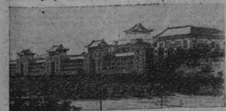
La estación ferroviaria de Hong-Kong, uno de los últimos focos de resistencia británica.