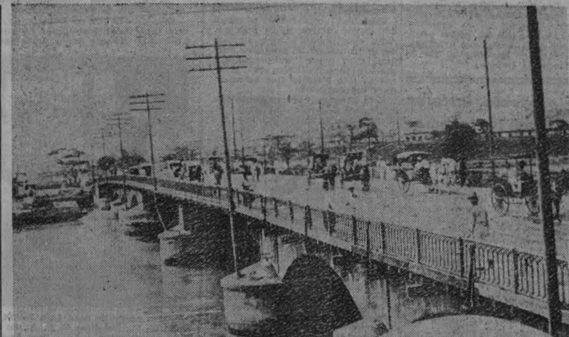
El puente de España, en la capital filipina, ya evacuada por el Gobierno y las fuerzas militares norteamericanas ante la inminencia del asalto japonés.