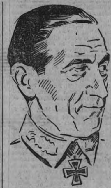
General Muñoz Grandes

"Españoles: En estos tiempos tan críticos y difíciles, en que con la suerte del mundo se ventila el porvenir de nuestra Patria, yo me dirijo a vosotros para, con todo entusiasmo y mucho calor en mi corazón, enviaros el saludo de mis soldados, de estos soldados buenos, sufridos y valientes, que sólo por ofrecer un día de orgullo están dispuestos a dar su vida con alegría. Duro es el enemigo y muy dura es también el invierno ruso. Pero no importa; más dura es mi raza, asistida por la razón y la valentía de sus hijos, que en abrazo estrecho con sus heroicos camaradas alemanes lograrán al fin la victoria, por la que sin cesar lucharemos. Estad tranquilos, españoles; conscientes de nuestra responsabilidad, cumpliremos el deber que nos habéis impuesto, sin aspirar a otra cosa que a nuestra satisfacción y contento. Desde estas tierras inhóspitas y lejanas