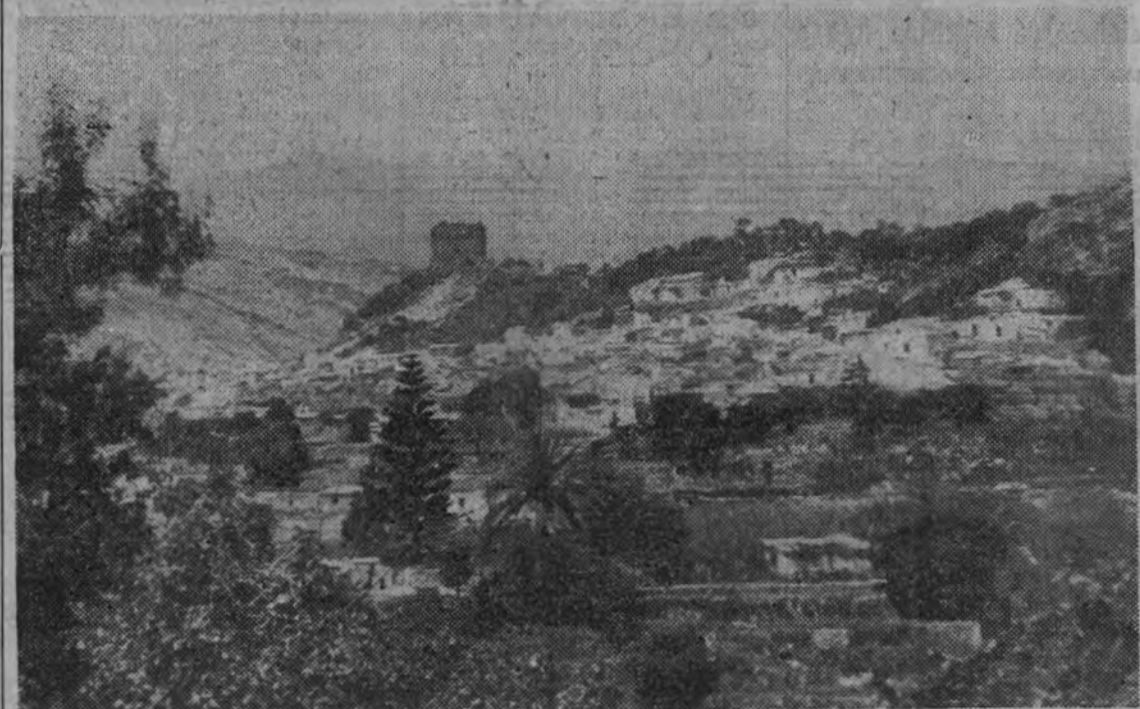
La ciudad de Granada, donde hoy comienza sus tareas el VI Consejo de la Sección Femenina

GRANADA 1.—En las primeras horas de la noche llegó Pilar Primo de Rivera. Su primera visita fue al templo de Nuestra Señora de las Angustias, donde oró. Después se trasladó al hotel Alhambra Palace, habilitado para residencia de las camaradas de la Sección Femenina, donde fue recibida por las autoridades y jerarquías. Una centuria de la Vieja Guardia le rindió honores. Se hallaban formados las camaradas de la Sección Femenina y el Frente de Juventudes, que desfilaron ante Pilar Primo de Rivera.