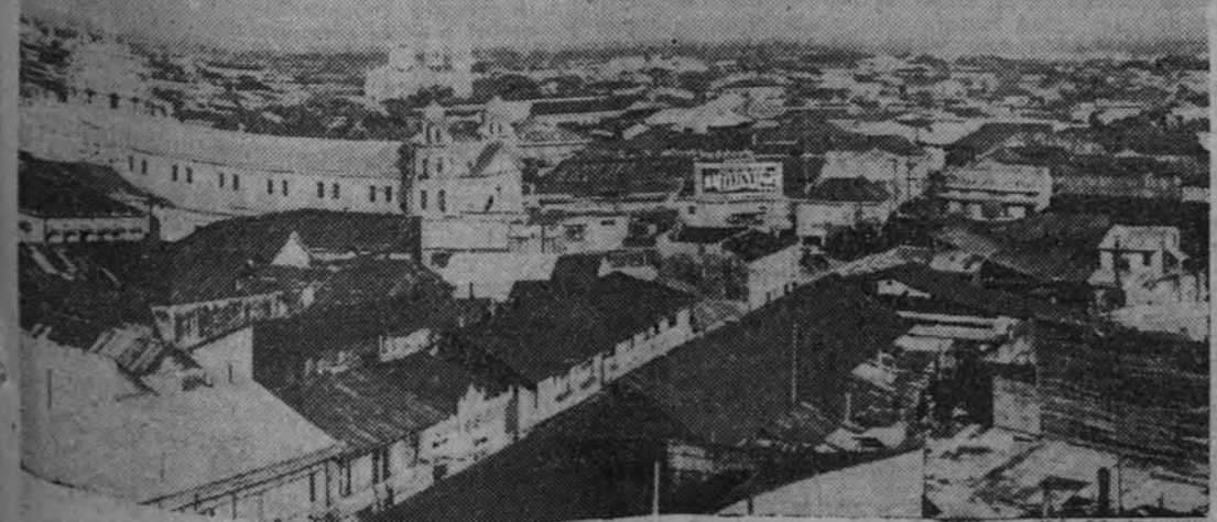
La ciudad de Manila, ya conquistada por los japoneses