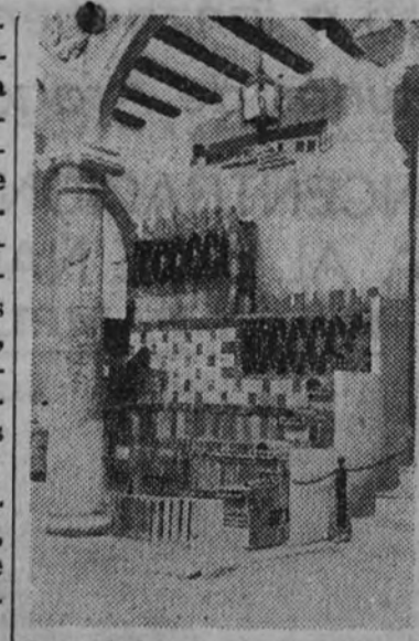
La cerámica, de arraigado prestigio en Almansa, ha llevado muestra de sus productos.

NUEVA ESCUELA DE FORMACION EN BARCELONA BARCELONA 3.—Dentro de breves días la Sección Femenina inaugurará en esta ciudad otra Escuela de formación para obreras, que será instalada en el edificio del S. E. U. de Valladares, y funcionará en paralelo a la que ya existe en la ciudad. En ella se darán clases diurnas y nocturnas.