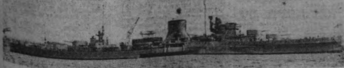
El crucero británico "Neptuno", que ha sido hundido

Este número de ARRIBA se vende al precio de TREINTA Y CINCO céntimos. Nuestros lectores deben exigir la entrega de nuestro suplemento semanal "S1"