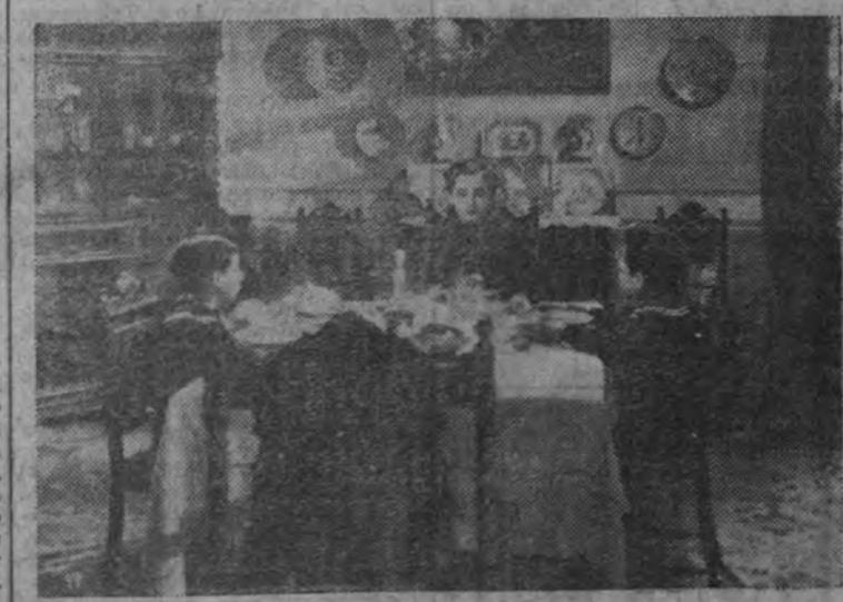
Una escena de la gran película.

Una larga y clamorosa ovación acogió el final de la extraordinaria película española