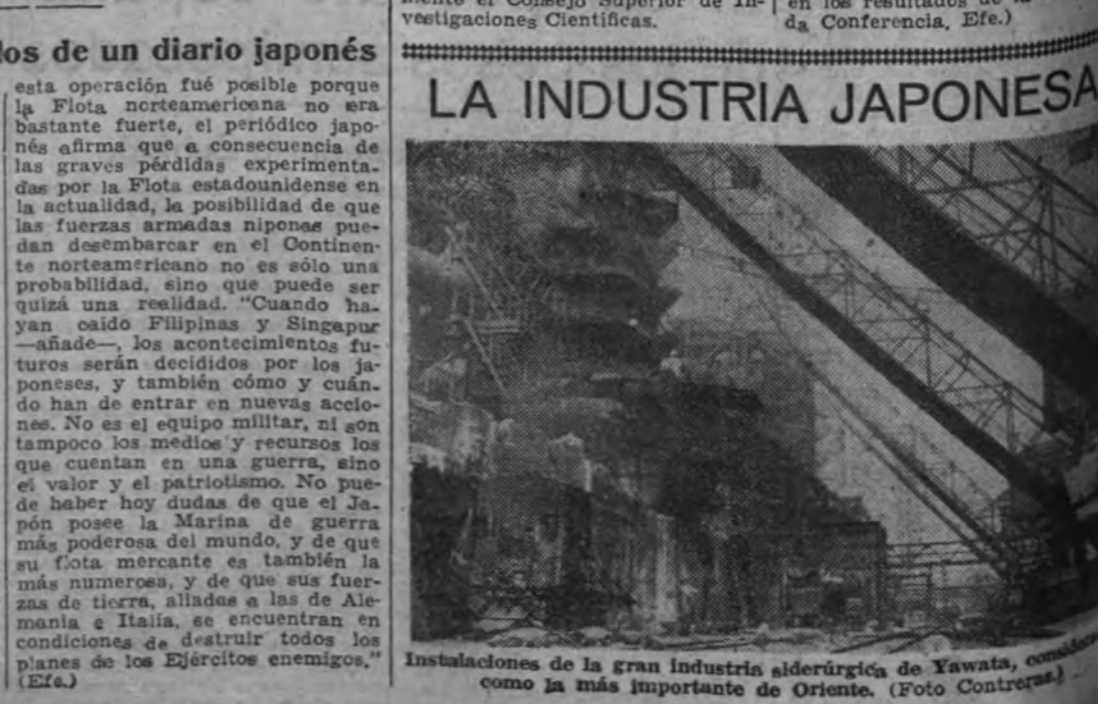
Instalaciones de la gran industria siderúrgica de Yawata, como la más importante de Oriente.