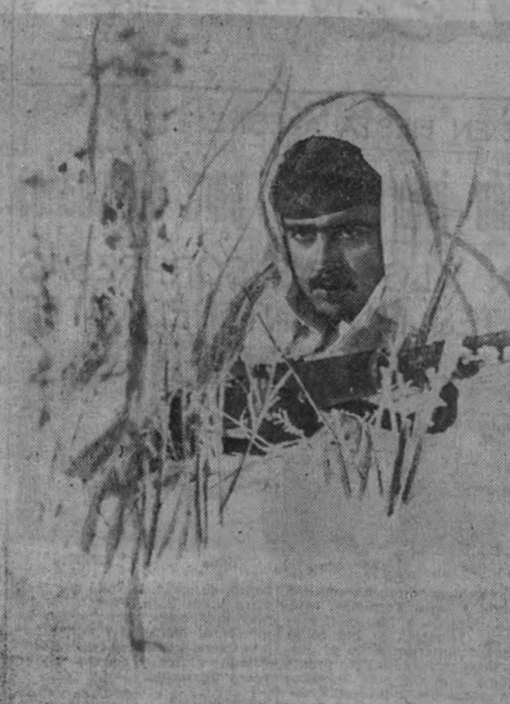
Este es el combatiente silencioso y fiel.

Hemos traído aquí—aunque no sea preciso—al recuerdo de España, en días señalados de grandeza y tragedia, de heroísmo y de dolor, a nuestros camaradas de la valiente División Azul. De la valiente División Azul, para los que este día y estos días de España amanecen en Rusia a más de 30 grados bajo cero.