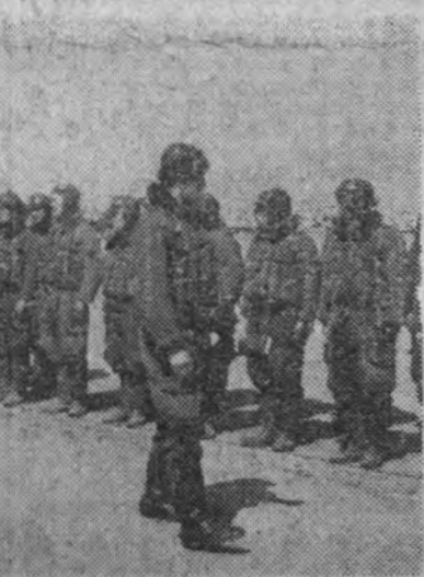
Los oficiales japoneses pasan revista a los aviadores que van a tomar parte en las operaciones contra los últimos reducidos ingleses en Malaca