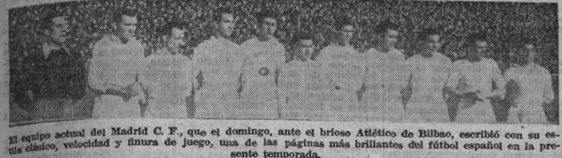
El equipo actual del Madrid C. F., que el domingo, ante el brioso Atlético de Bilbao, escribió con su estilo clásico, velocidad y finura de juego, una de las páginas más brillantes del fútbol español en la presente temporada.

La victoria madridista (3-2) debió ser más copiosa