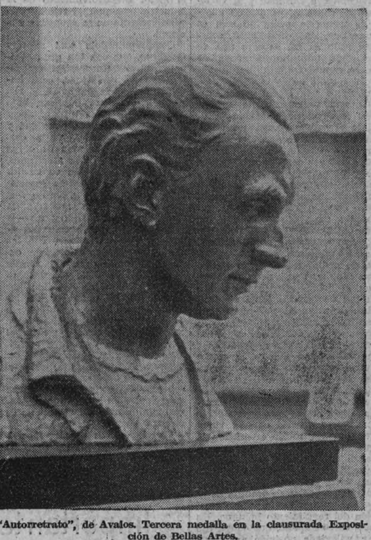
"Autorretrato", de Avalos. Tercera medalla en la clausurada Exposición de Bellas Artes.