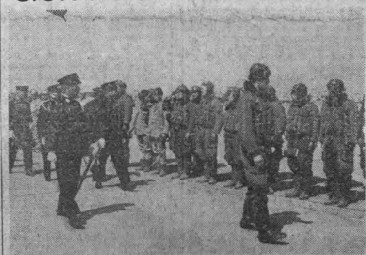
Los oficiales japoneses pasan revista a los aviadores que van a tomar parte en las operaciones contra los últimos reducidos ingleses en Malaca