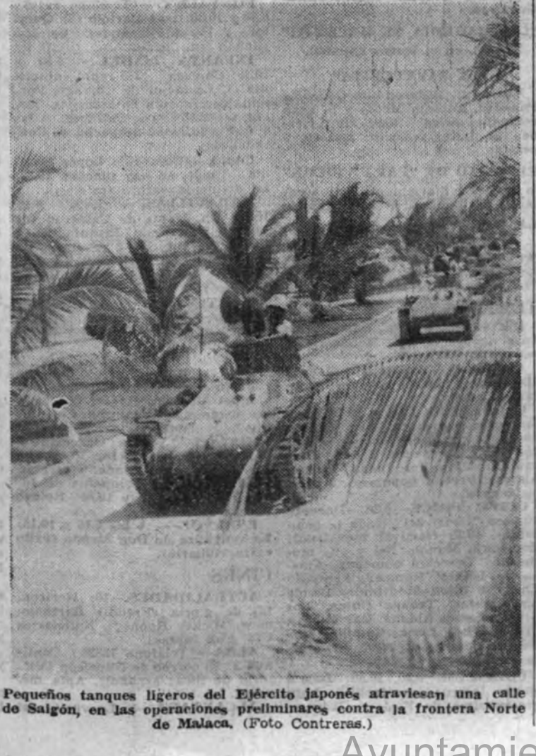
Pequeños tanques ligeros del Ejército japonés atraviesan una calle de Salomón, en las operaciones preliminares contra la frontera Norte de Malaca.

En el ministerio de Asuntos Exteriores facilitaron ayer tarde la siguiente nota: "La Legación imperial del Japon en Madrid ha hecho saber a este ministerio que, según informaciones recibidas en Tokio de las autoridades militares de ocupación en Manila, la colonia española residente en aquella ciudad y en los demás territorios filipinos ocupados por las fuerzas japonesas se encuentra sin novedad, no habiéndose producido bajas en ella a consecuencia de acciones de guerra."