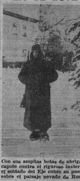
Con sus amplias botas de abrigo y capote contra el riguroso invierno, el soldado del Ejército suizo en el paisaje nevado de Rusia.