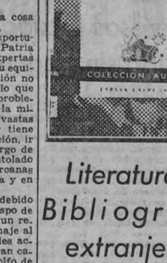
Algunos caracteres de la cultura española