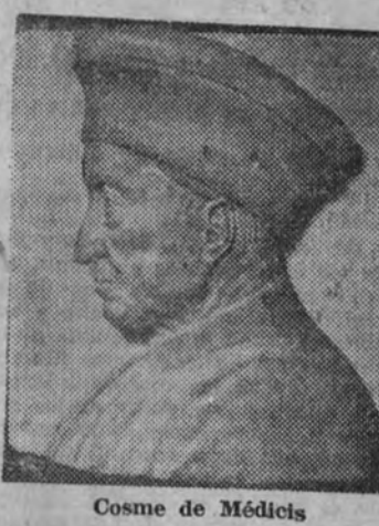
Cosme de Médicis