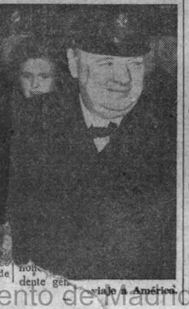
Churchill es recibido en el Ayuntamiento de Madrid