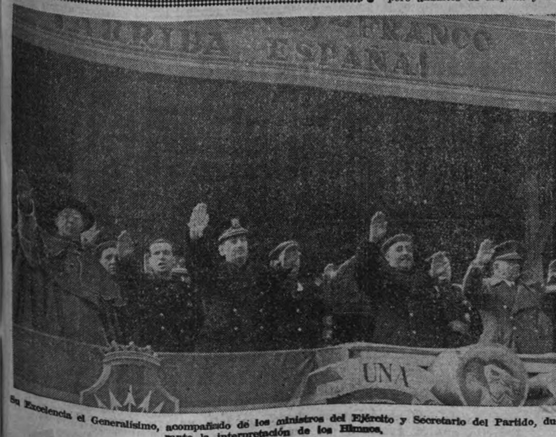
En Excelencia el Generalísimo, acompañado de los ministros del Ejército y Secretario del Partido, durante la interpretación de los Himnos.