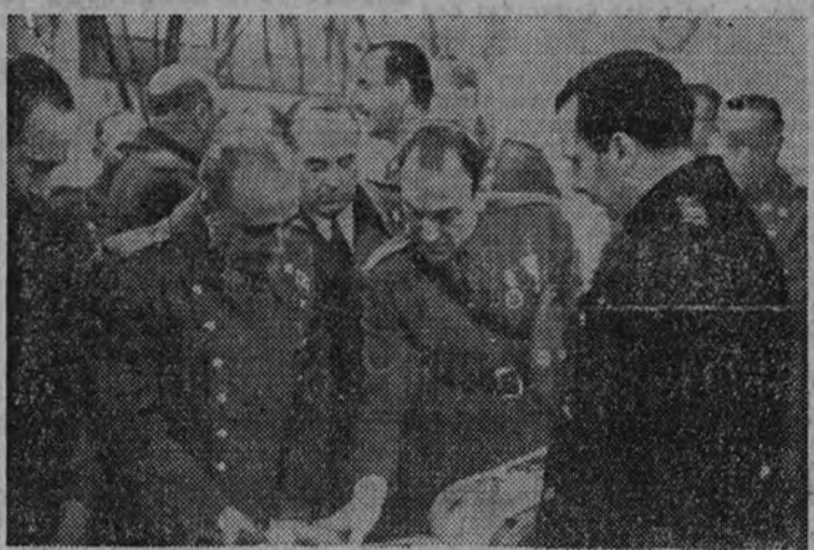
El Caudillo hojea el álbum de honor que le fué entregado en el Parque de Automovilismo del Ejército en Sabadell

Vosotros todos conocéis, como conocen todos los obreros de esta región, que nos pretendieron dejar una Patria en ruinas. Así se preparaba, así se quería y así se propalaba; y con esa Patria en ruinas, con los graneros vacíos, con las materias primas desaparecidas y con los transportes destruidos, hemos tenido que hacer vivir a España y sufrir nuestro calvario, contemplando a nuestras clases medias y a nuestras masas menos dotadas mal alimentadas, pero amantes de España y de