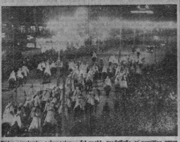
Entre constantes aclamaciones del pueblo madrileño, la comitiva cruza las calles de la capital

Apenas se distinguieron desde la pendiente de la calle de Alcalá, que termina en la Cibeles, las alabardas con los gallardetes nacionales de la escolta, cuando el gentío, unánime y fervoroso, tributo al Caudillo, entre el clamor de sus gritos y el murmullo de sus aplausos, un nuevo homenaje simbólico.