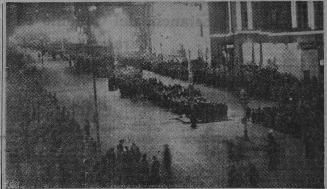
Una enorme muchedumbre llenó anoche las calles madrileñas para recibir al Jefe del Estado