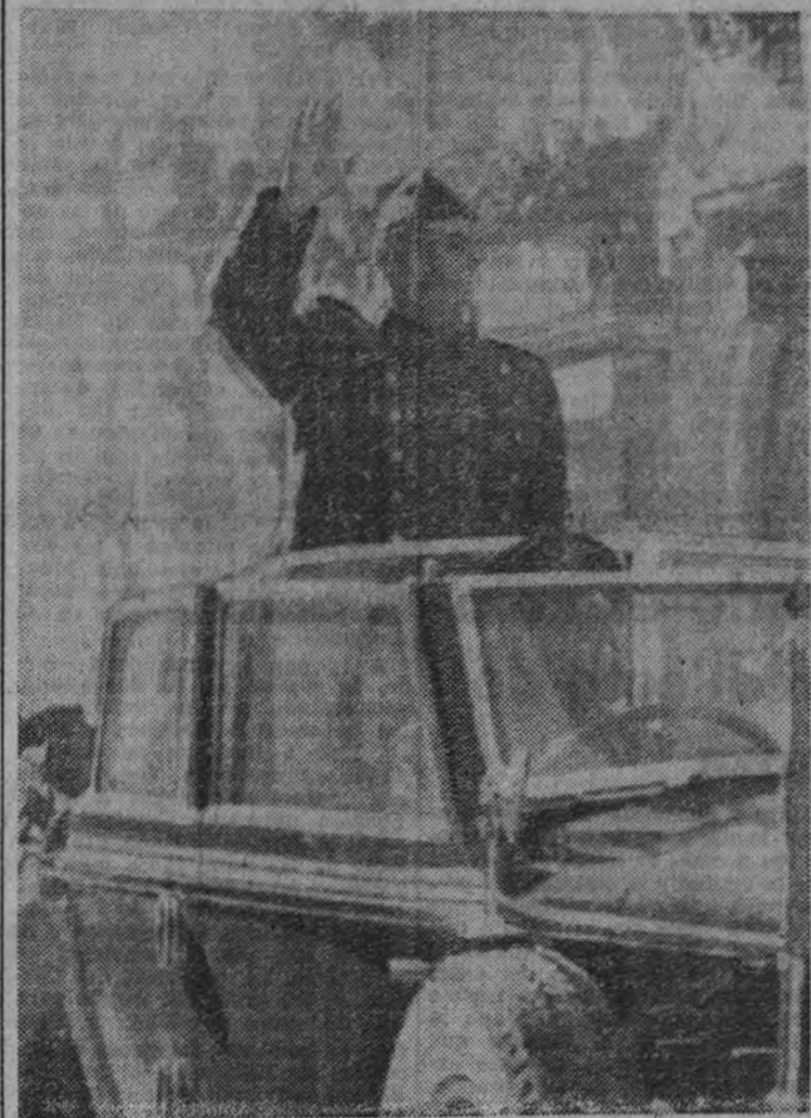
El Caudillo correspondiendo a las fervorosas muestras de entusiasmo y adhesión de los madrileños al hacer su entrada en Madrid ayer

"Esta es la asistencia que quiero de vosotros: que dejemos las pequeñas rencillas, los egoísmos del amor propio, esa egolatría española y ese cáncer de la envidia; que los destierremos, y que pensemos que para una empresa tan grande cual es levantar a España y conducirla por el camino del Imperio se necesitan tres cosas: un Mando, una disciplina y una obediencia". FRANCO