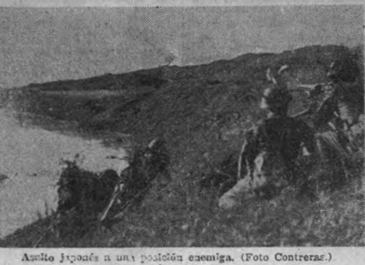
Avanzando a una posición enemiga.

"EL QUE QUIERA Y TENGA LA CONCIENCIA LIMPIA, COMO NOSOTROS, HA ENTRADO Y HA TOMADO EN LA FALANGE SU DIRECCION Y SU CONSIGNA; EL QUE NO QUIERA, TENED LA SEGURIDAD DE QUE, POR EL BIEN DE ESPAÑA, POR LA SALUD Y EL PORVENIR DE NUESTRA PATRIA Y DE TODOS LOS ESPAÑOLES, YA QUE ASI LO HEMOS JURADO SOBRE LA SANGRE DE LOS QUE CAYERON, SERA ARROLLADO."