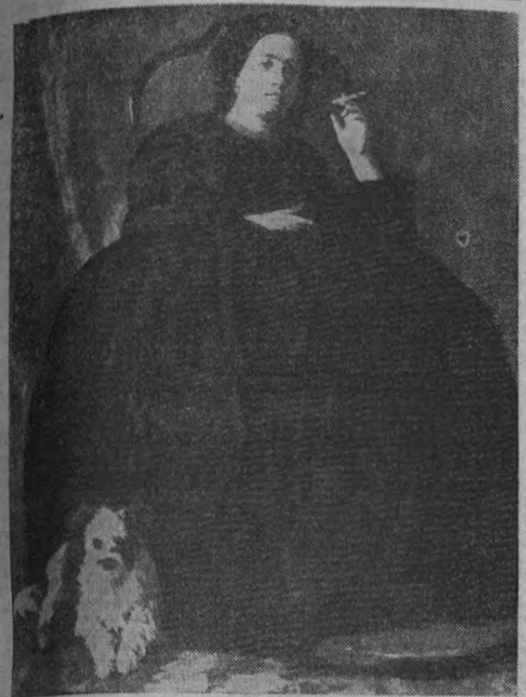
Aman: La mujer del perro.

I Deambulando por el antiguo ámbito dacio, desde Maramures hasta Oltenia, pasando por Valaquia y por Moldavia, recorriendo los caminos y las montañas de esta gran lejana, que guarda en su lejanía una postura un vivo sabor de balada pastoril o de conseja antañona de lobos en tristes y roquedales, topamos continuamente con la sugerencia de una Naturaleza vigorosa y definida. Y esta Naturaleza atrapa a la desprevenida imaginación, ya derrochando por sus pedregales peñascos de abetos, ya ensordecándonos en la óptima extensión de sus planicies doradas de espigas o en verdaderas de hierba, pero siempre concluyendo por ser pedernal que atormentando el espíritu humano lo inflama como yuca al conato del asombroso colorido del distante país rumano. La magnífica atracción de esta tierra viene a ser igual tanto para los viajeros extraños como para el melancólico boyero que la habita y deseara con el roncó gruñido de su larga trompeta de caña. Y es la atracción, hecha sentimiento entrañable, se plasma en el verbo nervioso de los escritores, de los poetas y de los pintores rumanos, y por ellos el mundo entero puede admirar la Naturaleza que los cautiva, y que es toda color y dulzura agrícola.