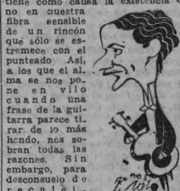
Regino Sainz de la Maza

perfectamente toda la trama de la guitarra desde el rincón más lejano del Español. Creemos sinceramente que en potencia de sonido guitarrístico no cabe un más allá. Encontrámonos a Sainz de la Maza—el concierto de ayer ha sido acaso el mejor de su historia—en la cumbre de su peculiarísima manera de tocar, que aprovecha todos los resortes posibles. Entre la agri-dulce fricción del sonido arrancado con uña, hasta la blanda resonancia producida por la yema, Regino hace posible una cantidad de matices que justifican la calidad polifónica de la guitarra. Sobre todo, una innata facilidad de mano izquierda—larga, flexible y exacta—salva esa inminencia de abismo que siempre parece amenazar el instrumento. Es una técnica forjada al servicio de la mejor seriedad interpretativa: ése es su valor.