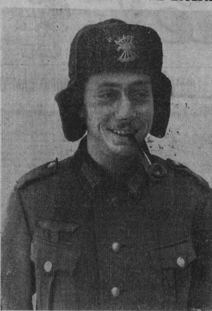
Un camarada de la División Azul ostenta orgulloso el emblema de la Falange sobre un gorro arrebatado al enemigo.