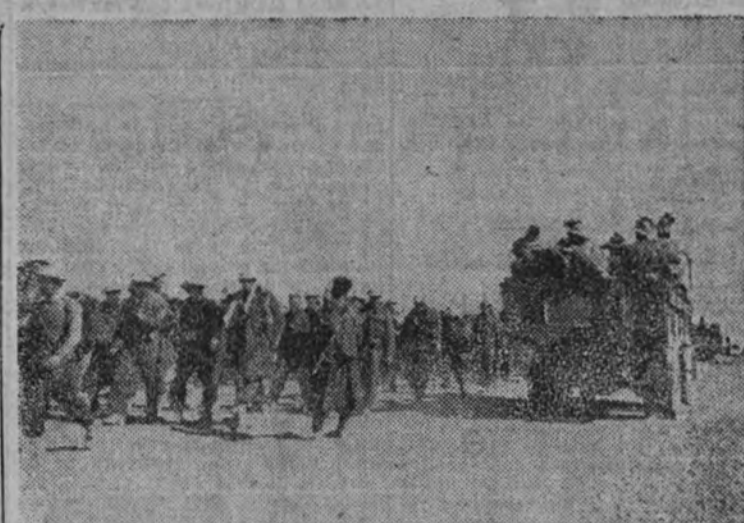
Columnas de prisioneros capturados por las tropas de Rommel, que avanzan en el sector de Derna.

EL CAIRO 4. — Comunicado británico: "Después de rechazar importantes destacamentos alemanes que trataban de interceptar su retirada, nuestra cuarta división india acabó, en la noche del 2 al 3 de febrero, su movimiento de repliegue hacia la última posición de cobertura que ocupaba en las proximidades de Derna. Dicha división se ha unido ya al grueso de nuestras fuerzas. En tanto, nuestras columnas móviles, apoyadas por fuerzas aéreas, prosiguen la retirada organizada en la Cirenaica oriental hacia duramente castigadas. El avance de las tropas del Eje se prosigue hacia Derna, vigorosamente apoyado por la Aviación."