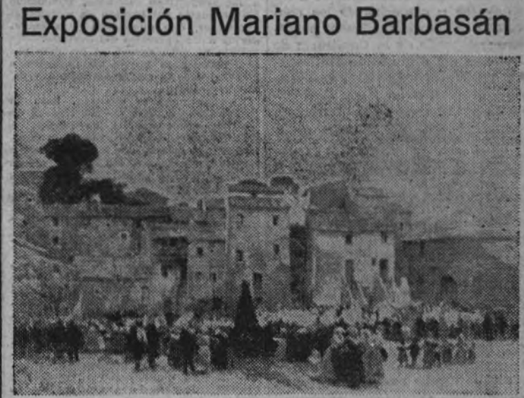
"Procesión del día de San Pedro", admirable cuadro de Barbasán que figura en la Exposición abierta de la Casa Macarrón.