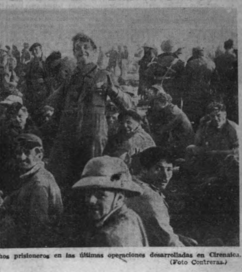
Grupo de soldados ingleses hechos prisioneros en las últimas operaciones desarrolladas en Cirenaca.