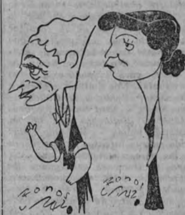
Barnum y Zulayna.

Barnum, el célebre ilusionista que durante algún tiempo recorrió los escenarios con el famoso Albatraz, repareció anoche en el teatro Fontalba con todo su mundo mágico lleno de bellas fantasías.