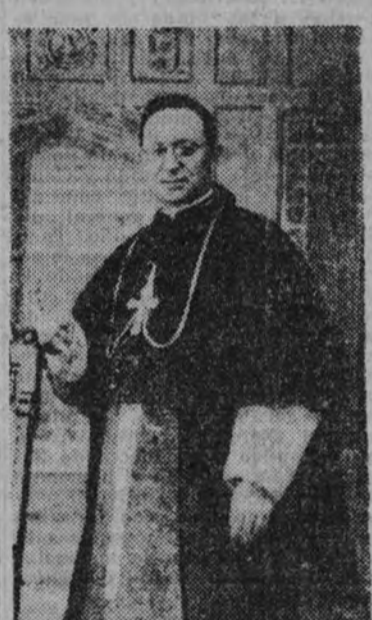
Fray Anselmo Polanco, obispo de Teruel, asesinado por los rojos.

Jornada ejemplar de la Iglesia, supo en todo momento hermanar lo religioso con lo nacional, e incluso el Movimiento, pronto se