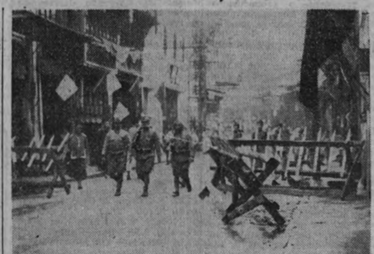
Infantería japonesa patrullando por las calles de una de las últimas ciudades conquistadas en la península de Malaca.

TOKIO 6.—El ministro de Transportes del Japón, Terayima, ha declarado hoy en la Dieta que el Gobierno ha establecido ya un plan para llevar a cabo la construcción de gran número de barcos durante el año actual. El proyecto es el mayor que se ha hecho hasta ahora en la historia de la navegación japonesa. El ministro puso de relieve que, al contrario de lo que se ha dicho en los Estados Unidos, que siempre se quedan en proyecto, el Japón está en situación de realizar todos sus planes. A pesar de la escasez de toneladas que existe actualmente, el problema—añadió—no puede inquietarnos. El Gobierno ha creado además una Oficina Naval, que se encargará de emplear convenientemente todos los barcos, bajo la inspección del Estado. (Efe.)