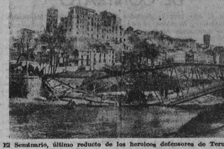
El Seminario, último reducto de los heroicos defensores de Teruel.

Roto, sediento, enfermo, marchó al cautiverio. San Miguel de los Reyes, en Valencia; Pi y Margall, en Barcelona; prisión flotante. Uno más en la desgracia. Su pa-