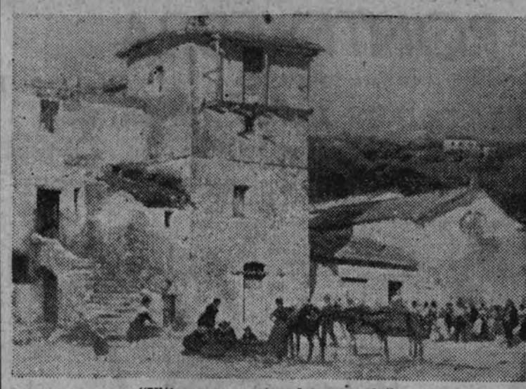
"Últimos momentos del mercado".