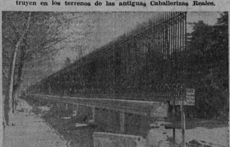
Un aspecto de la antigua verja de Caballerizas.