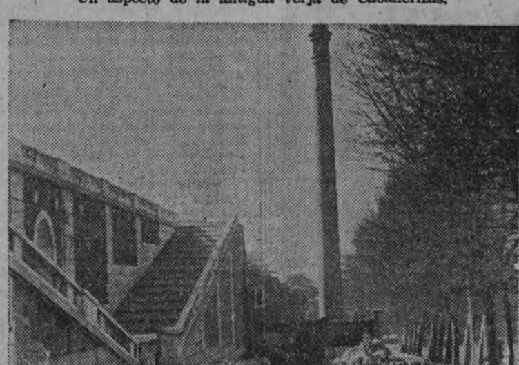
La escalinata de los patios de Caballerizas que da acceso al Campo del Moro.

El proyecto del Ayuntamiento, hace años estudiado, de trazar un acceso digno de Madrid y de sus necesidades actuales y futuras, transformando el antiguo paseo de San Vicente, hoy Onésimo Redondo, se está realizando con gran actividad. El paseo de Onésimo Redondo no se parará en nada al antiguo de San Vicente. Tomando terrenos del Campo del Moro, en la izquierda de la calle, se ensancha ésta al doble del viejo paseo. Se hará más suave la subida, pues la rasante anterior constituía uno de los más graves inconvenientes, y se trazará una bella plaza en la salida principal de la estación de los Ferrocarriles del Norte, en la confluencia con la carretera de la Bombilla y con el paseo de la Virgen del Puerto. Este proyecto de ensanche del paseo de Onésimo Redondo tendrá su complemento con la nueva alineación de la plaza de España, cuyo trazado será también modificado, y con los jardines de Caballerizas, que constituirán el punto de arranque de esta vía, que quedará transformada en uno de los más bellos accesos a la capital.