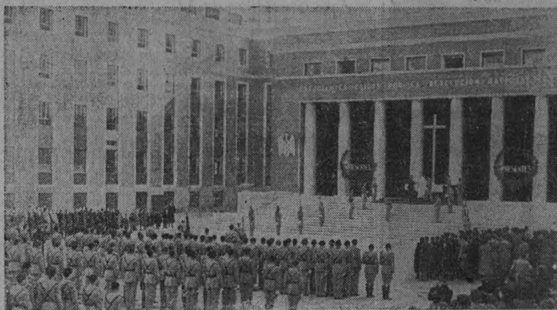
La Ciudad Universitaria durante la celebración del Santo Sacrificio de la Misa.