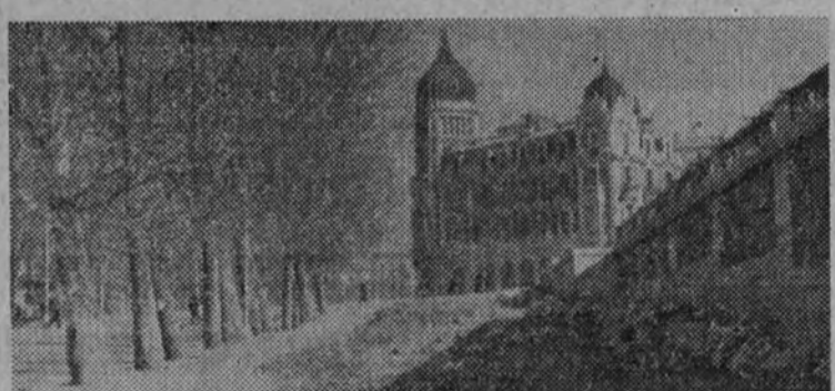
Retirada la verja y explanado el terreno; así quedará el paseo de Onésimo Redondo en la acera a que dan los jardines que se construyen en los terrenos de las antiguas Caballerizas Reales.

El ancho de esta vía será doble que el que tenía y se trazará una bella plaza en su confluencia con la carretera de la Bombilla