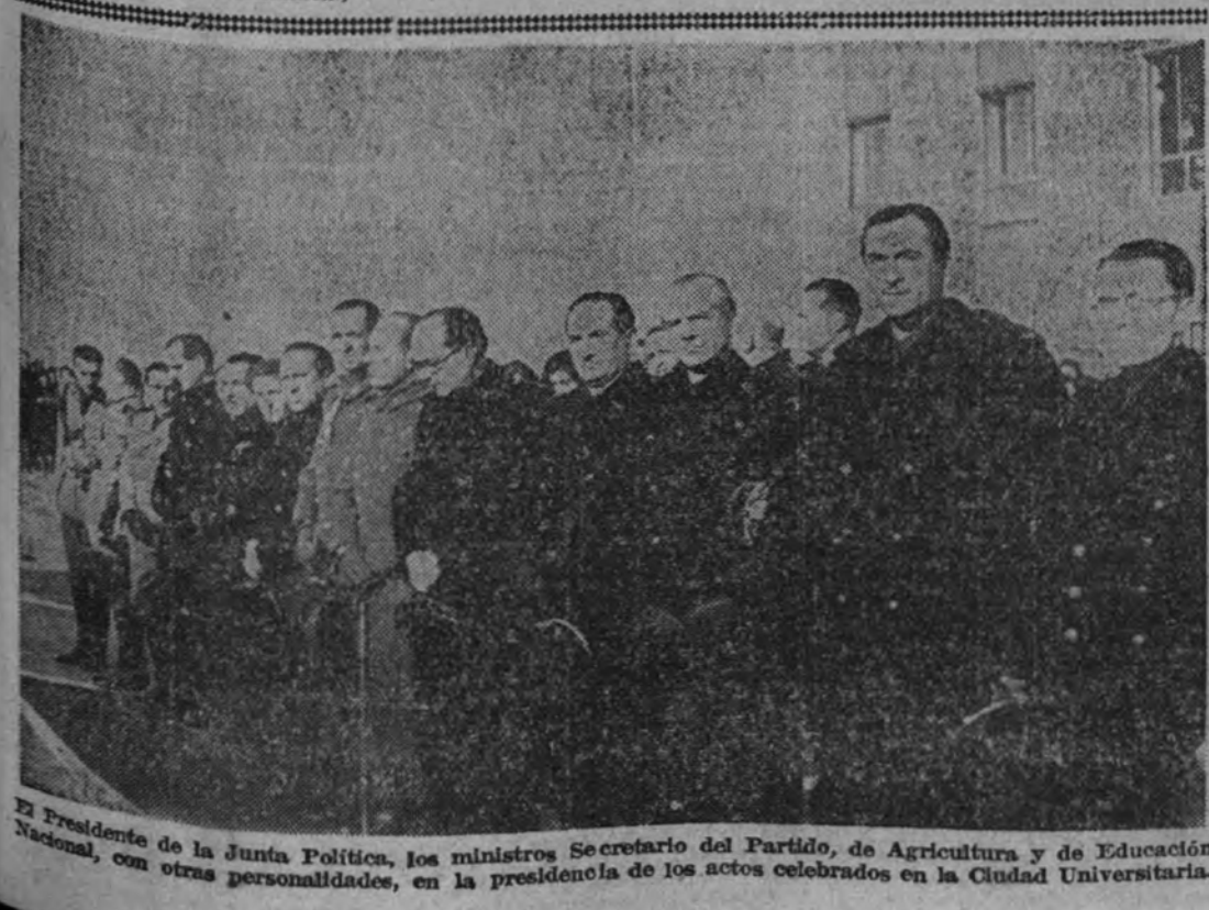
El Presidente de la Junta Política, los ministros Secretario del Partido, de Agricultura y de Educación Nacional, con otras personalidades, en la presidencia de los actos celebrados en la Ciudad Universitaria.

(Palabras de FRANCO en el Servicio Social de Alta Cultura Económica.)