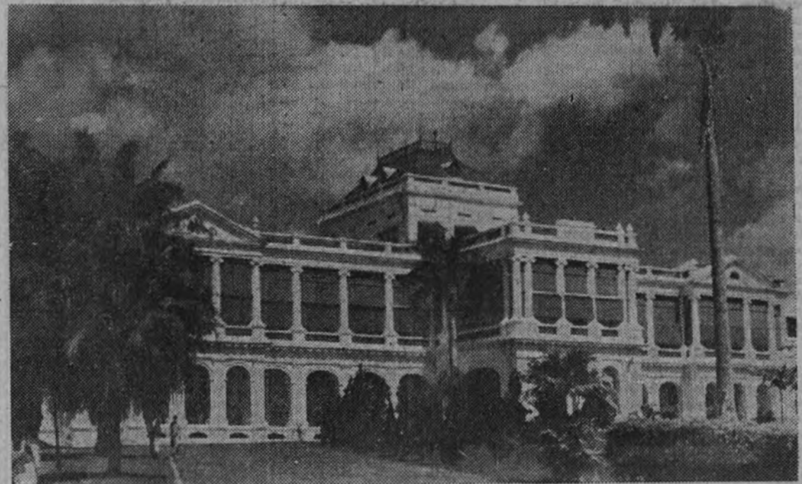
El palacio de Singapur, donde ya resuenan los cañonazos japoneses

UNIDADES REGULARES INDIAS LUCHAN AL LADO DE LOS JAPONESES