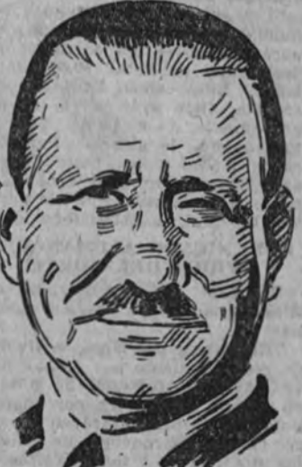
Joaquín Aguilera, presidente de la Federación Nacional de Hockey

Y no es la de menos peso la que tiene relación con el campo. En Lyon, los campos son de hierba. Nuestros jugadores seleccionados de Cataluña y de Castilla son todos—están habituados a la técnica del campo duro. ¿Qué puede ser el resultado?