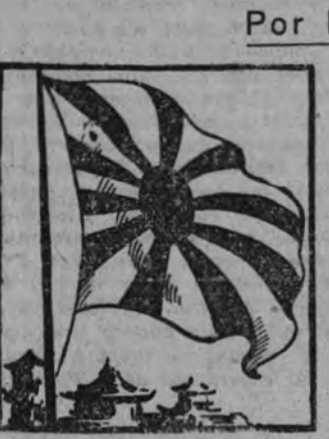
No hay nada tan impresionante en la semana transcurrida como la concurrencia de esos dos mil sesientos aniversario de la fundación del Mikado y la conquista de Singapur, en una misma fecha. Verdad que a los veintidós siglos cabales del establecimiento del Imperio les sobre el plus de un año para redondear mejor cifras pero es un poco que se asemeja a ese extremo apendicular de Malaca, en el que ondea a estas horas la bandera del Sol Naciente.

Hay algo tan holgado para el hombre como gozarse el mundo de la rotación de los días, el curso de la vida, el devenir de la historia. En cuanto vive y ha de vivir—nos ha formulado Goethe a los occidentales—tiene que prevalecer el sujeto sobre el objeto y ser el uno más fuerte que el otro. Y lo vencerá, lo consumirá, como la llama a la sombra (Gorta a Riemer). No hemos recibido los europeos mejor legado del mundo antiguo, de la vida césarea. Y cuando un movimiento de los espíritus busca en la levadura de la antigüedad nuevo fermento a la realización de sus formas, el "homo universal" del Renacimiento—el de Colloane o el de San Jorge—se nos muestra en actitud ecuestre, con la vida apresada entre las riendas. Dos antagónicas tendencias contienen en cada instante vital que abordamos: la que nos sitúa por encima de las cosas y la que nos sitúa en el acontecer de una energía autónoma, que nos arrastra en su invencible torbellino. Y hay en el declive de la vida civilización del dinero ese apoderamiento del hombre por el automatismo fatal de las cosas, que hace decir a André Gide, refiriéndose al mundo norteamericano: "Estamos en presencia de una teocracia del rendimiento, que anhela más la producción de las cosas que la creación y la formación de los hombres."