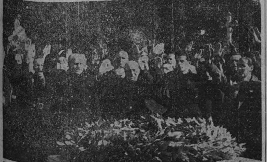
Serrano Suñer, después de depositar una corona ante la tumba de Miguel García Miguera, primer caído de la vieja Falange sevillana.