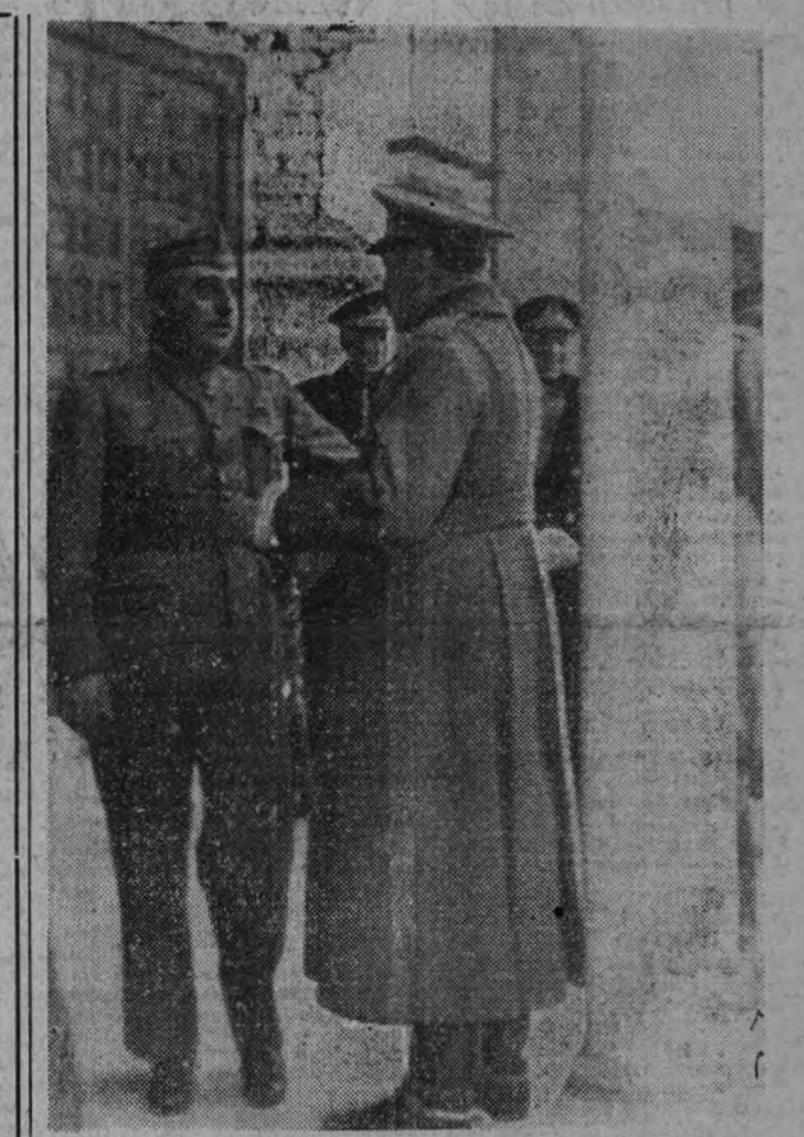
El Generalísimo conversa con el capitán general de la región a su salida del Alcázar.

MELBURNE 14.—Drakeford, ministro australiano del Aire, ha declarado hoy: "El Gobierno de Australia tiene el propósito de llamar a los miembros de las fuerzas aéreas australianas que se encuentran en Gran Bretaña, una vez que las dificultades de transporte hayan sido vencidas." (Efe.)