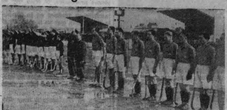
Del partido de hockey Francia-España jugado el domingo en Lyon. El momento en que los equipos, cuadrados, oyen los himnos nacionales.

Si hemos de buscar las causas de la derrota del equipo español de hockey en Lyon, ante el nacional francés, en la mañana del siguiente día de la victoria en Barcelona, nos encontramos con dos factores: el cansancio del viaje y el terreno embarrado.