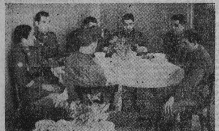
La hora de la comida en el nuevo Hogar del Soldado de la División Azul

Veinte voluntarios que llegaron ayer a la capital quedaron instalados en el Hogar