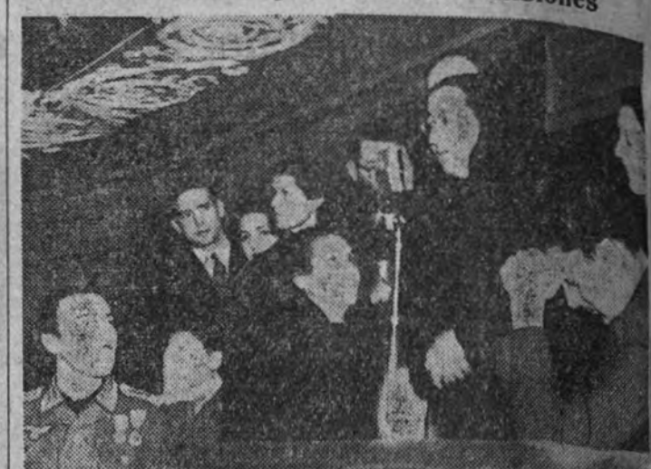
Desde un palco del teatro Español, una madre habla por el micrófono para su hijo, que la oirá emocionada desde las heladas estepas

Cinco madres de combatientes hablarán cada día a sus hijos en estas emisiones