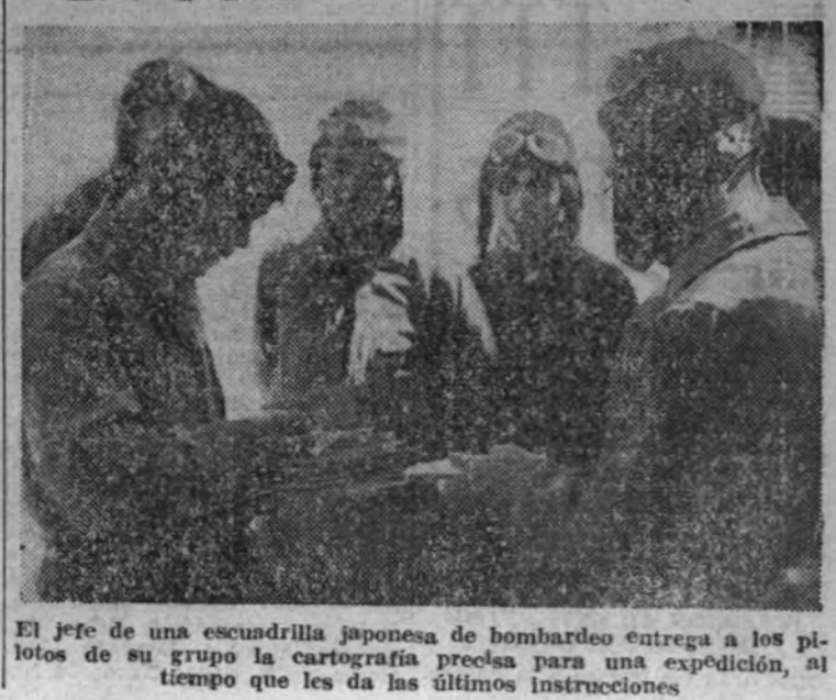
El jefe de una escuadrilla japonesa de bombardeo entrega a los pilotos de su grupo la cartografía precisa para una expedición, al tiempo que les da las últimas instrucciones.