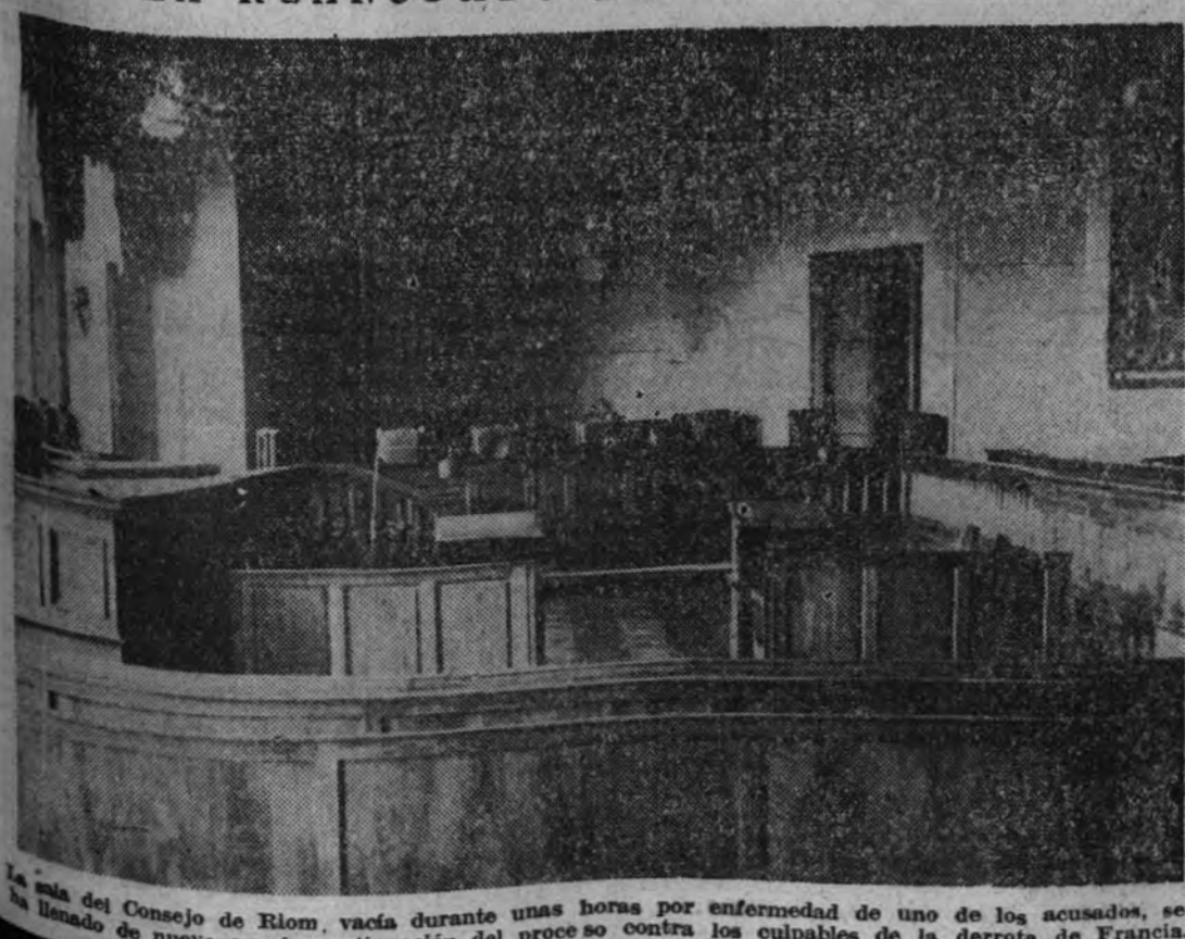
La sala del Consejo de Riom, vacía durante unas horas por enfermedad de uno de los acusados, se ha llenado de nuevo con la continuación del proceso contra los culpables de la derrota de Francia.