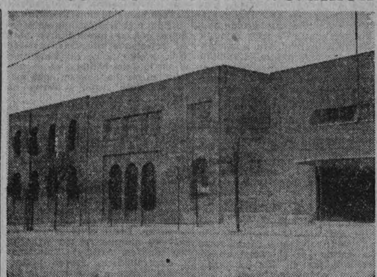
Aspecto exterior del edificio en donde está instalado el Instituto de San José de Calasanz.

Hasta el momento funcionan ya en el Instituto las siguientes Secciones: Filosofía, Pedagogía, Di-