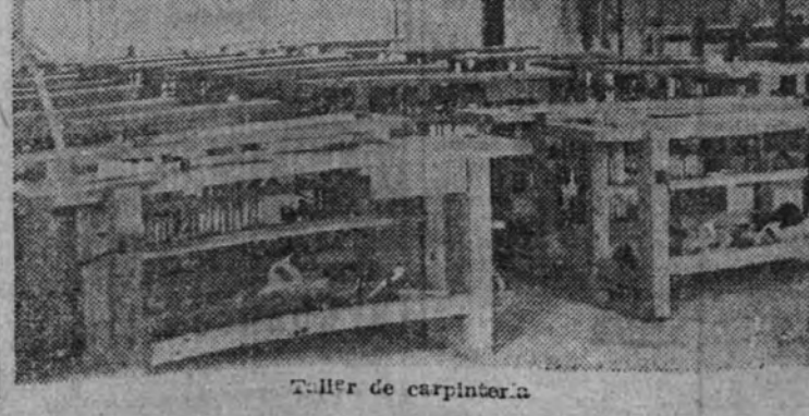
Taller de carpintería.